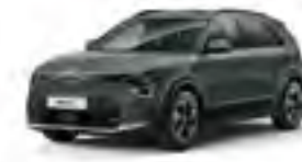
Cityscape Green (CGE)