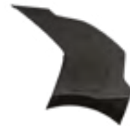
Aurora Black Pearl (ABP) Niro HEV/PHEV modellekhez rendelhető