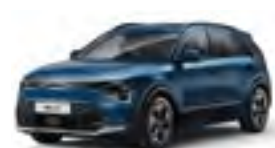
Mineral Blue (M4B)