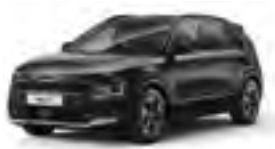
Aurora Black Pearl (ABP)