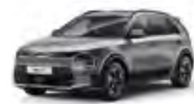
Steel Gray (KLG)