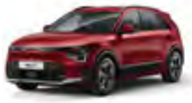
Runway Red (CR5)