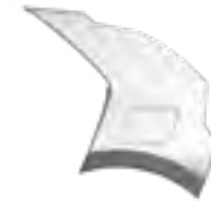
Steel Gray (KLG) Niro EV modellekhez rendelhető