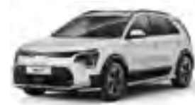
Clear White (UD)