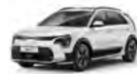
Clear Snow-White Pearl (SWP)