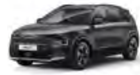
Interstellar Gray (AGT)