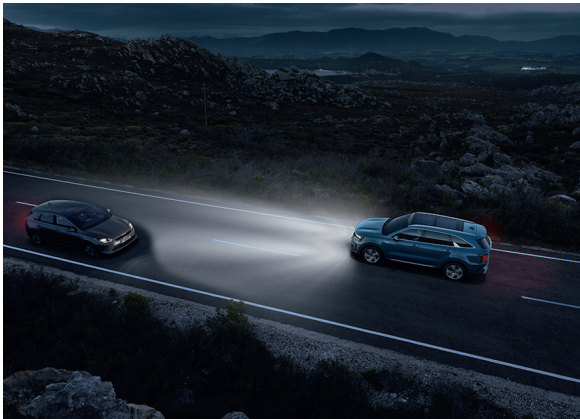
Gestion intelligente des feux de route (HBA)

Vivez des sensations fortes et de nouvelles expériences tout en préservant votre sécurité. Le tout nouveau Sportage se dote des systèmes avancés d'aide à la conduite, la technologie Kia DriveWise, une gamme complète d'équipements innovants et de technologies de pointe visant à vous garantir une sécurité optimale en toutes conditions.