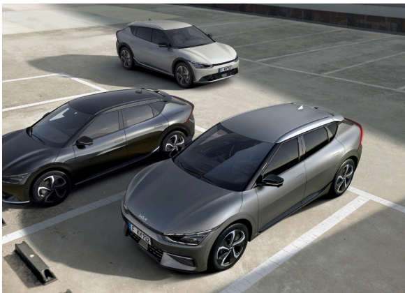
Système de détection de trafic arrière avec fonction freinage (RCCA) / piéton (PCA)