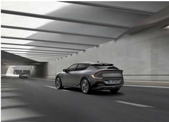
Assistance active à la conduite sur autoroute (HDA)