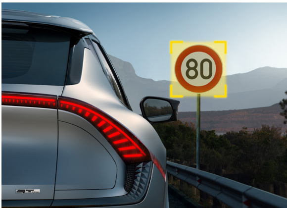
Reconnaissance des panneaux de limitation avec régulation de vitesse (ISLA)