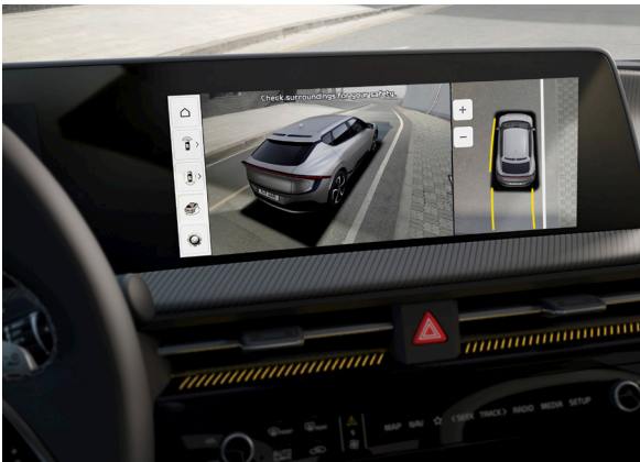
Moniteur avec vision panoramique 360° (SVM)