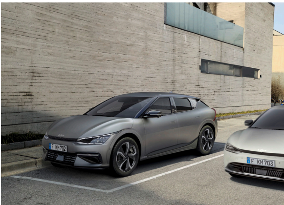
Avertissement de sécurité de sortie du véhicule (SEW)