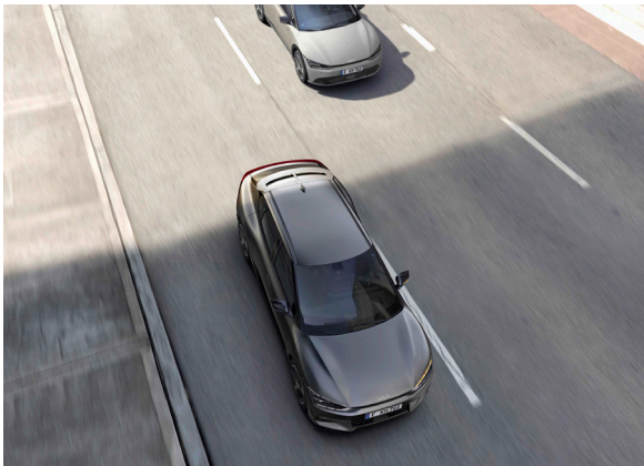
Système anticollision avec détection des angles morts (BCA)