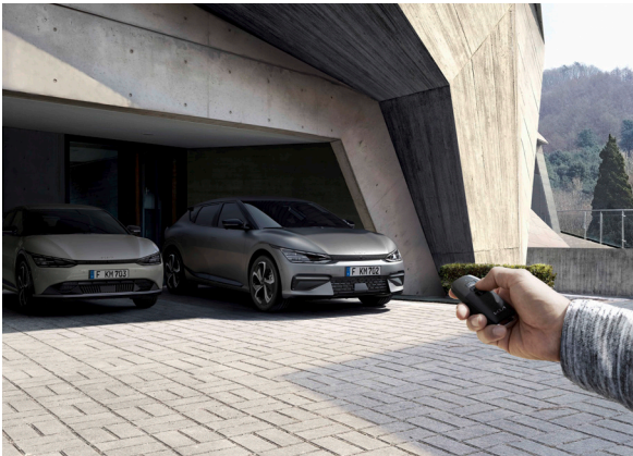
Assistance au stationnement à distance (RSPA)