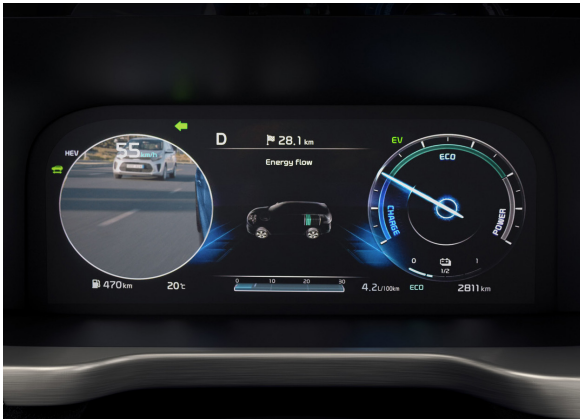
Système d'affichage des angles morts (BVM)