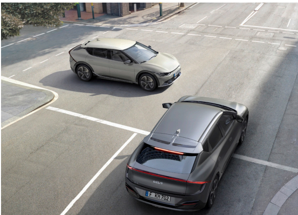
Freinage d'urgence autonome avec détection des piétons et des cyclistes (FCA) fonction croisement