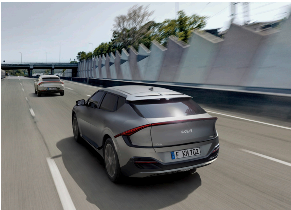
Régulateur de vitesse adaptatif couplé au système de navigation (NSCC-C)