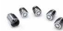
Tuercas de seguridad y llave para llantas

Nada capta más la atención que las llantas de aleación originales de Kia. Han sido diseñadas para complementar las elegantes líneas de tu Kia Optima y cumplen con los estrictos estándares de fabricación de la marca Kia.