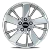
1. Llanta de aleación de 16", tipo B