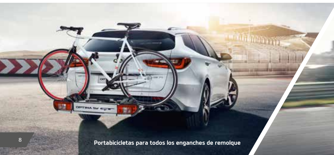
Portabicicletas para todos los enganches de remolque

Haz tu nuevo Kia Optima más práctico aún con los funcionales accesorios originales.