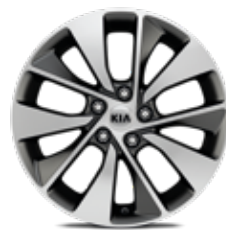
5. Llanta de aleación de 18", tipo A