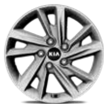
2. Llanta de aleación de 16", tipo D