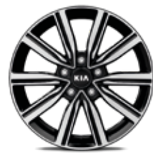
4. Llanta de aleación de 17", tipo B