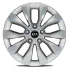
3. Llanta de aleación de 17", tipo B