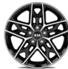
7. Llanta de aleación de 18", tipo D