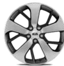
6. Llanta de aleación de 18", tipo B