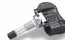
TPMS (Sistema de control de la presión de los neumáticos)

1. Llanta de aleación de 16", tipo B Llanta de aleación de 16", gris claro, 6.5Jx16, adecuada para neumáticos 215/60 R16. Incluye una tapa y cinco tuercas.