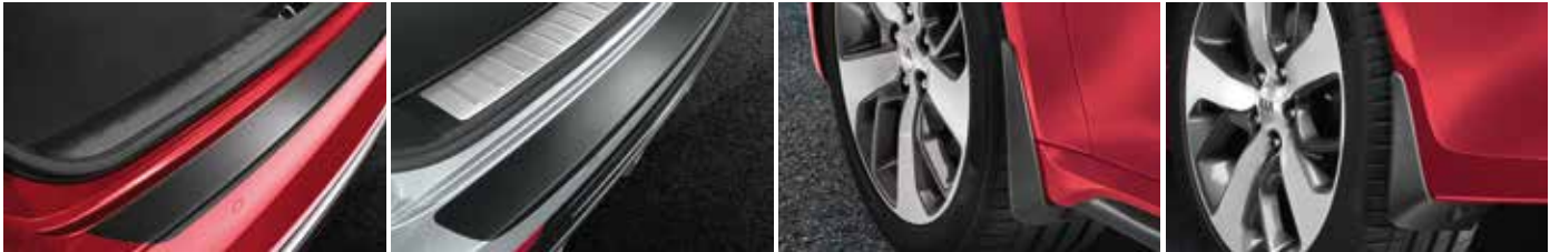
Lámina adhesiva de protección para el paragolpes trasero, negra Lámina adhesiva de protección en color negro fabricada a medida para la parte superior del paragolpes trasero de tu vehículo. Evita posibles daños en la pintura durante las cargas y las descargas.

Set de guardabarros delanteros y traseros Ayuda a proteger los bajos, los umbrales y las puertas del vehículo de una suciedad excesiva, aguanieve o salpicaduras de barro. Fabricado a medida para el Kia Optima.