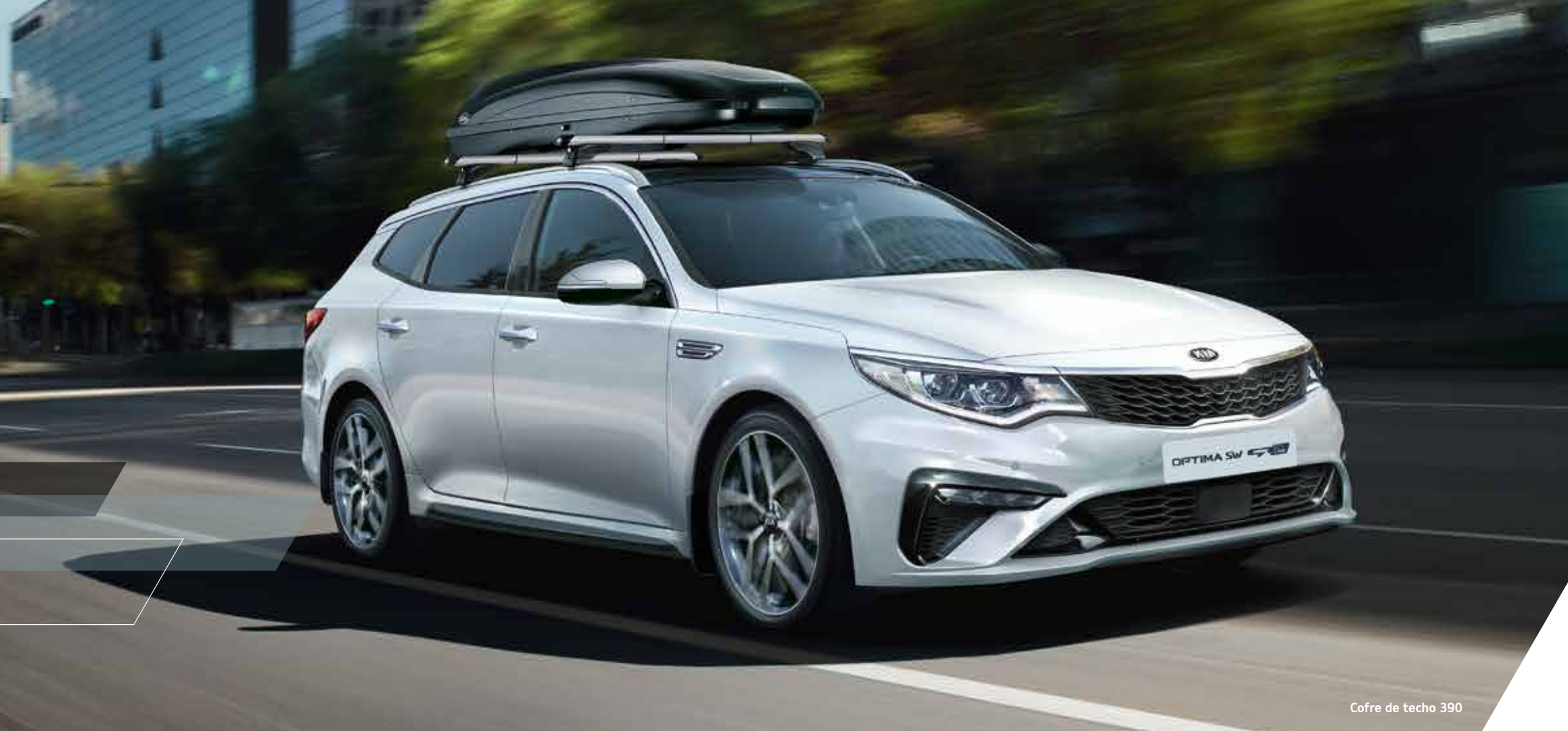
Cofre de techo 390