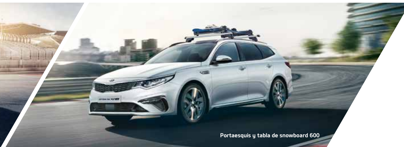
Portaesquí y tabla de snowboard 600