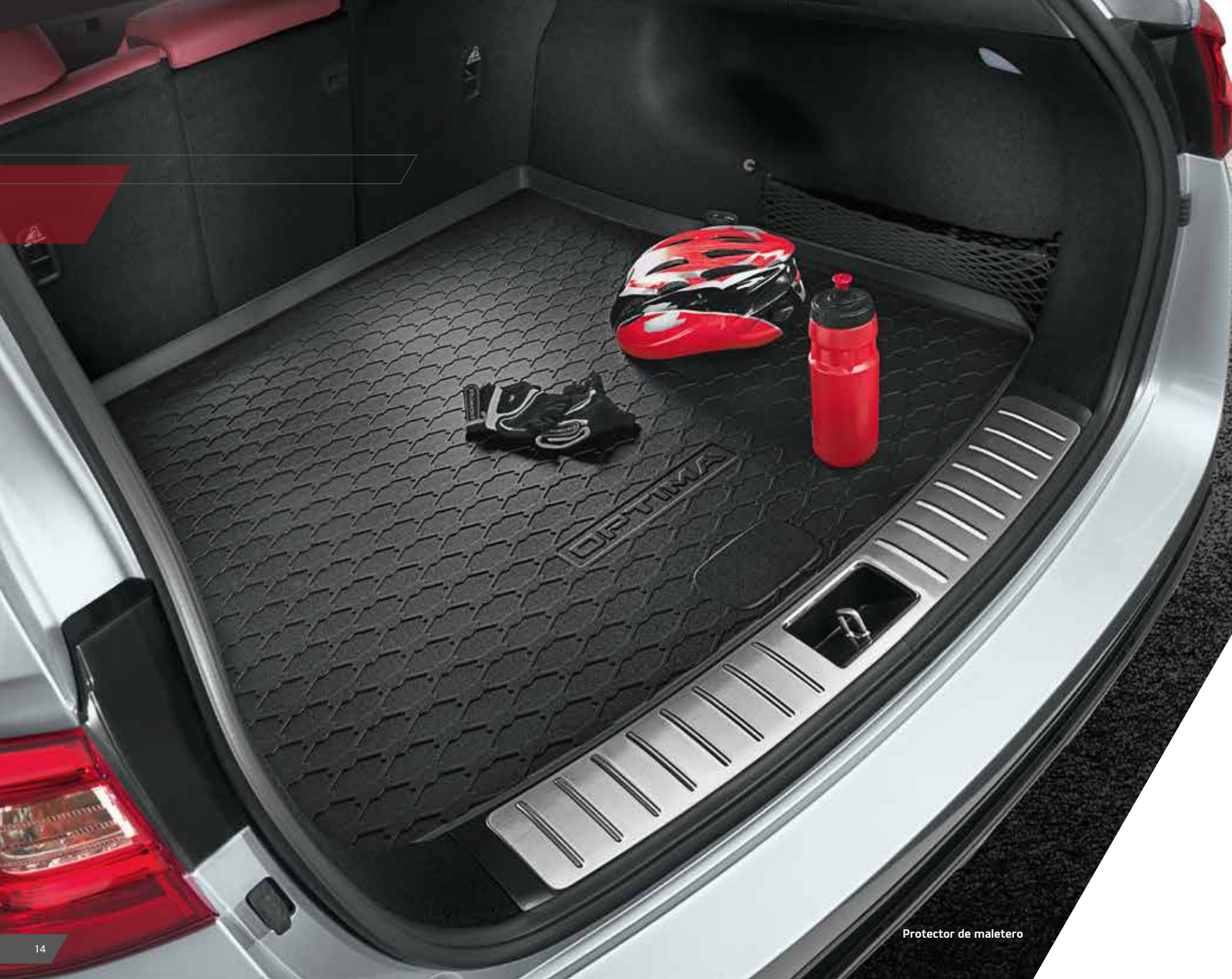
Protector de maletero