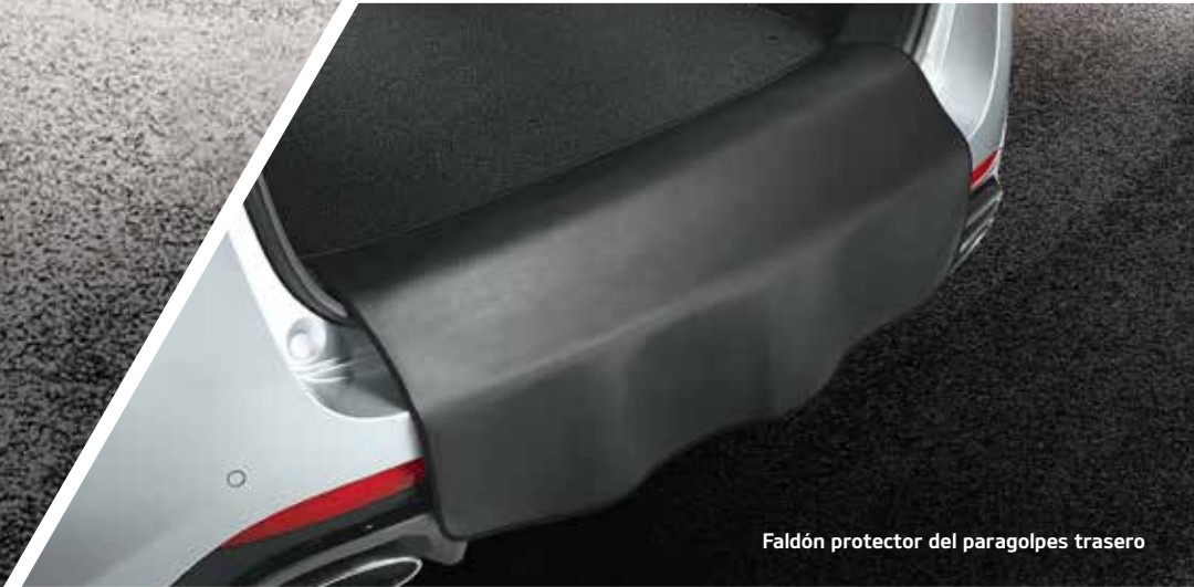
Faldón protector del paragolpes trasero

Si cuidas bien de tu nuevo Kia Optima, lo mantendrás como nuevo durante más tiempo, como recién salido del concesionario.