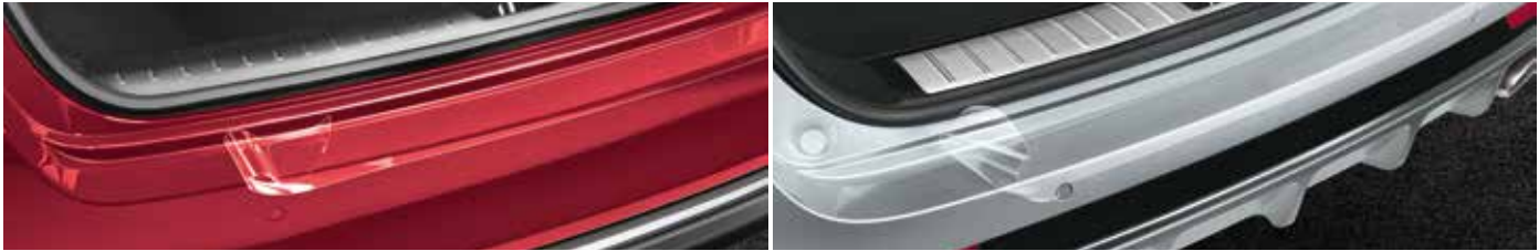
Lámina adhesiva de protección para el paragolpes trasero, transparente Resistente lámina adhesiva protectora transparente para la parte superior del paragolpes trasero de tu vehículo. Evita posibles daños en la pintura durante las cargas y las descargas.

Set de guardabarros delanteros y traseros Ayuda a proteger los bajos, los umbrales y las puertas del vehículo de una suciedad excesiva, aguanieve o salpicaduras de barro. Fabricado a medida para el Kia Optima.