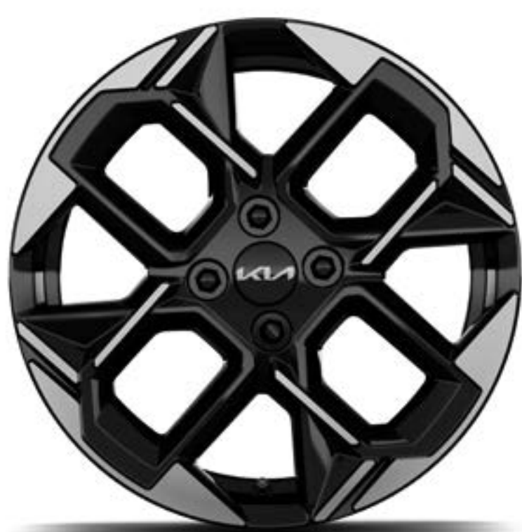
Llanta de aleación de 16" GT-Line