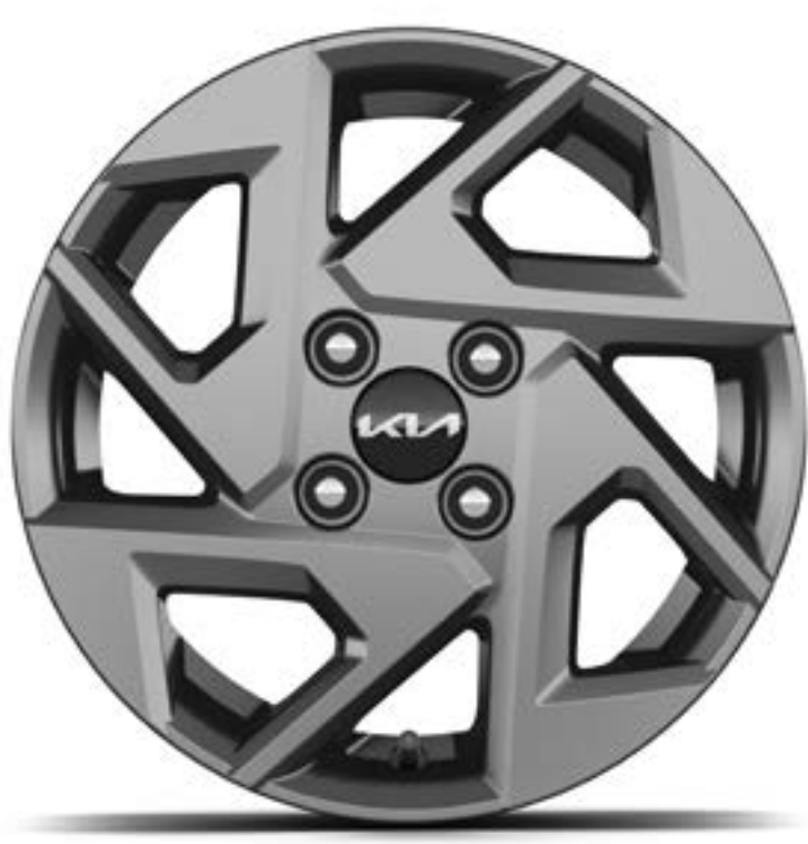
Llanta de aleación de 14"