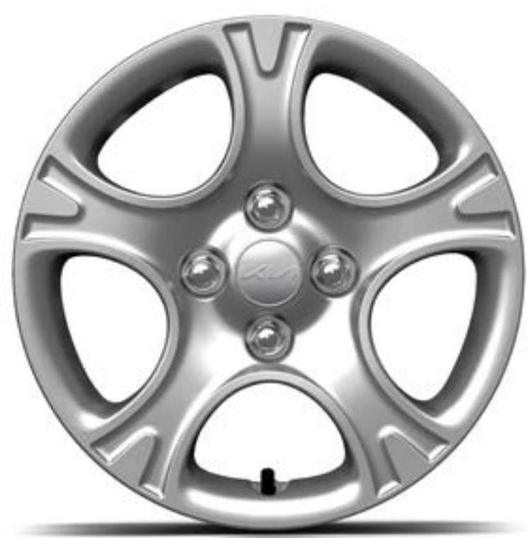
Llanta de acero de 14"