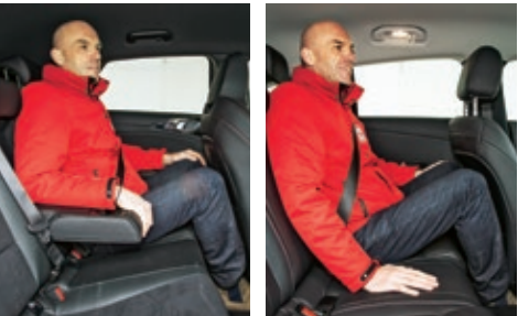
Platz im Fond gar nicht sooo schlecht, Rückbank im Benz (r.) liegt sehr tief

Der ProCeed geht zackig ums Eck, fühlt sich flott und leichtfüßig an, wiegt ja auch 162 Kilo weniger als der CLA. Macht Spaß! Kia hat ihn betont stramm abgestimmt, er federt steifer und holpriger als der Mercedes, auf langen Strecken muss man das mögen. Herausragend: die Bremsen. Der ProCeed stand beim Stopp aus Tempo 100 mit warmen Bremsen schon nach 33,4 Metern.