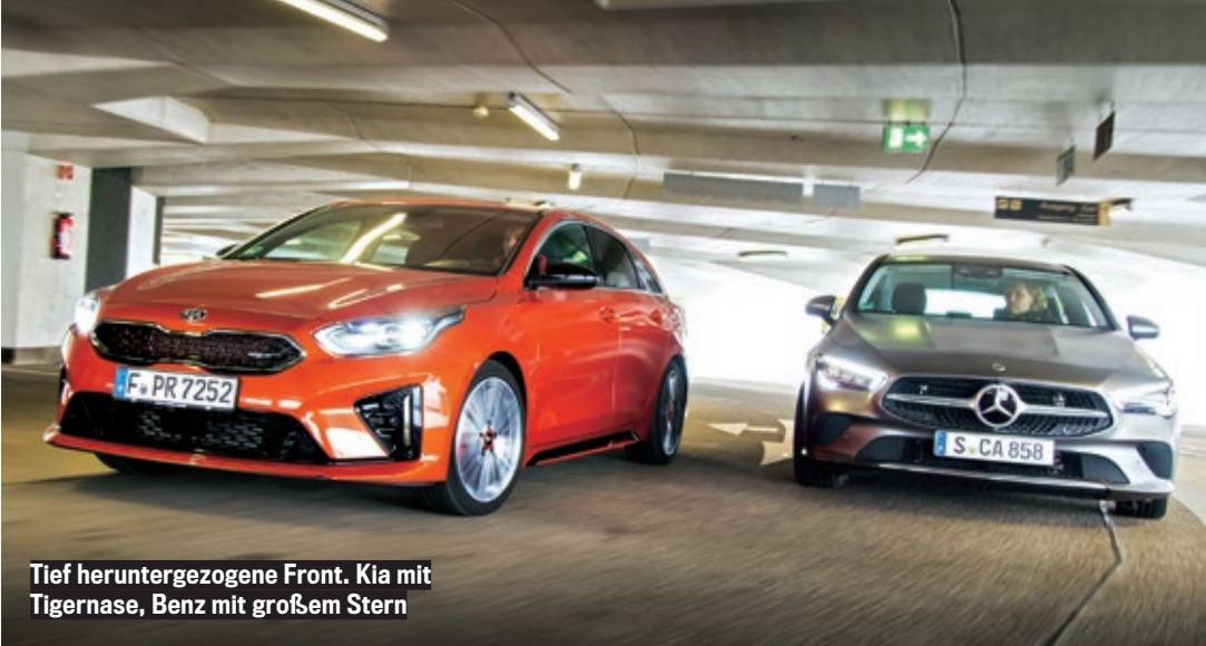
Tief heruntergezogene Front. Kia mit Tigernase, Benz mit großem Stern

* ermittelt von SCHWACKE. Bewerten Sie Ihr Fahrzeug auf www.autobild.de