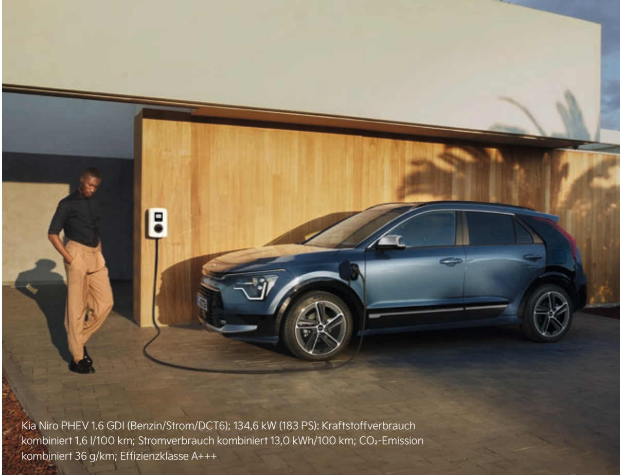
Kia Niro PHEV 1.6 GDI (Benzin/Strom/DCT6); 134,6 kW (183 PS); Kraftstoffverbrauch kombiniert 1,6 l/100 km; Stromverbrauch kombiniert 13,0 kWh/100 km; CO 2 -Emission kombiniert 36 g/km; Effizienzklasse A+++