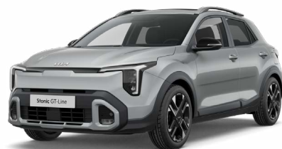
Sparklingsilber Met. (KCS)