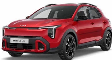
Signalrot Met. (BEG)