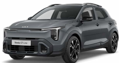
Astrograu Met. (M7G)