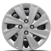
15-Zoll-Stahlfelgen mit Radzierblende (Core)

Bei einigen unserer modernen Metallicfarben werden bewusst unterschiedliche Farbpigmente verwendet. Dadurch können unter bestimmten Lichtverhältnissen, z.B. direktes Sonnenlicht, attraktive Farbeffekte erzielt werden. Zum Teil kann die Farbe changieren, z.B. von Schwarz zu Dunkelblau. Bei den hier abgebildeten Farbdarstellungen kann es aufgrund der Drucktechnik zu Abweichungen zu den Originalfarben kommen. Weitere Informationen zu den Farbeffekten und Grundfarben erhältst du bei deinem Kia-Partner. Metalliclackierungen sind aufpreispflichtig.