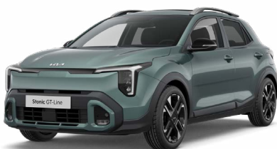
Adventurous Green Met. (A2G)