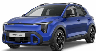
Yachtblau Met. (DU3)