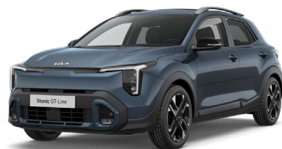
Denimblau Met. (EU3)