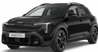
Auroraschwarz Met. (ABP)