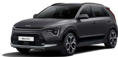
Interstellar Grau Metallic (AGT)