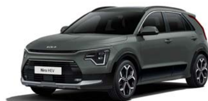
Cityscape Grün Metallic (CGE)