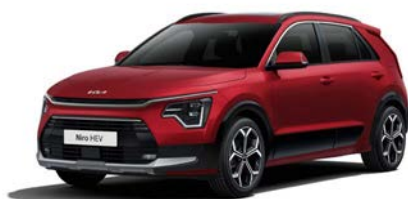
Runway Rot Metallic (CR5)

Bei einigen unserer modernen Metallicfarben werden bewusst unterschiedliche Farbpigmente verwendet. Dadurch können unter bestimmten Lichtverhältnissen, z. B. direktes Sonnenlicht, attraktive Farbeffekte erzielt werden. Zum Teil kann die Farbe changieren, z. B. von Schwarz zu Dunkelblau. Bei den hier abgebildeten Farbdarstellungen kann es aufgrund der Drucktechnik zu Abweichungen zu den Originalfarben kommen. Weitere Informationen zu den Farbeffekten und Grundfarben erhältst du bei deinem Kia-Partner. Metalllackierungen sind aufpreispflichtig.