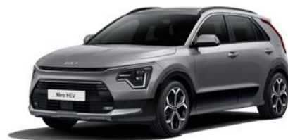
Stahlgrau Metallic (KLG)