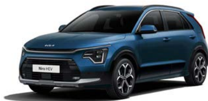
Mineralblau Metallic (M4B)