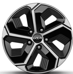
16-Zoll-Leichtmetallfelgen (Serie für Core und Vision)

Bei einigen unserer modernen Metallicfarben werden bewusst unterschiedliche Farbpigmente verwendet. Dadurch können unter bestimmten Lichtverhältnissen, z. B. direktes Sonnenlicht, attraktive Farbeffekte erzielt werden. Zum Teil kann die Farbe changieren, z. B. von Schwarz zu Dunkelblau. Bei den hier abgebildeten Farbdarstellungen kann es aufgrund der Drucktechnik zu Abweichungen zu den Originalfarben kommen. Weitere Informationen zu den Farbeffekten und Grundfarben erhältst du bei deinem Kia-Partner. Metalllackierungen sind aufpreispflichtig.