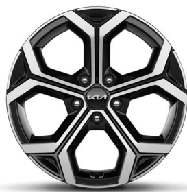
18-Zoll-Leichtmetallfelgen (Serie für Spirit)