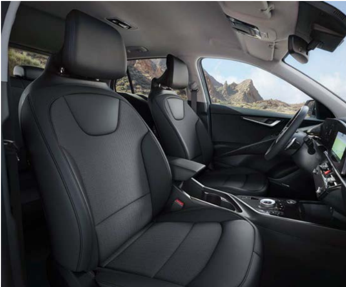
Sitzbezüge in Stoff-Leder-Kombination (mit hochwertiger Ledernachbildung), Charcoal (CCV) (Vision)