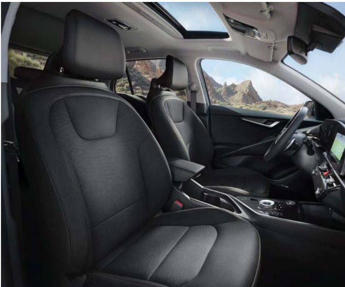
Sitzbezüge in hochwertiger Ledernachbildung, Charcoal (CCV) (Spirit)