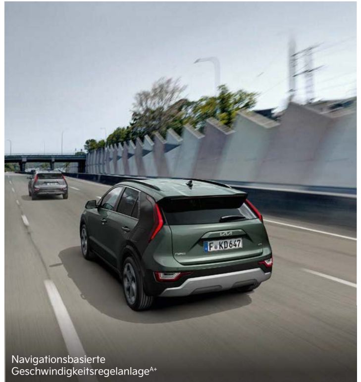
Navigationsbasierte Geschwindigkeitsregelanlage A+

Zusätzliche Sicherheit beim Zurücksetzen aus Parklücken oder langsamem Manövrieren im Rückwärtsgang: Der Kollisionsvermeidungsassistent (Parking Collision-Avoidance Assist, PCA) registriert mit Unterstützung der Rückfahrkamera sowie der hinteren Ultraschallsensoren, ob sich Fußgänger