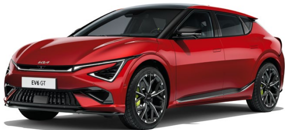
Runway Rot Metallic (CR5)

Der Kia EV6 GT ist so individuell wie du. Passe ihn deinem Stil an. Denn jedes Detail zählt.