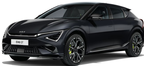
Auroraschwarz Met. (ABP)