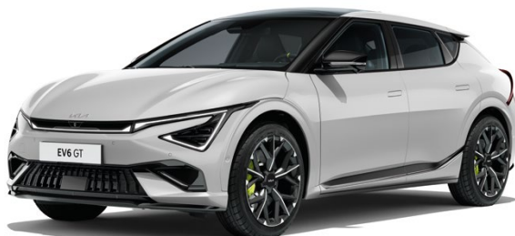
Wolfgrau Met. (C7S)