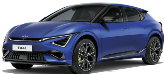
Yacht Blau Matt (DUM)