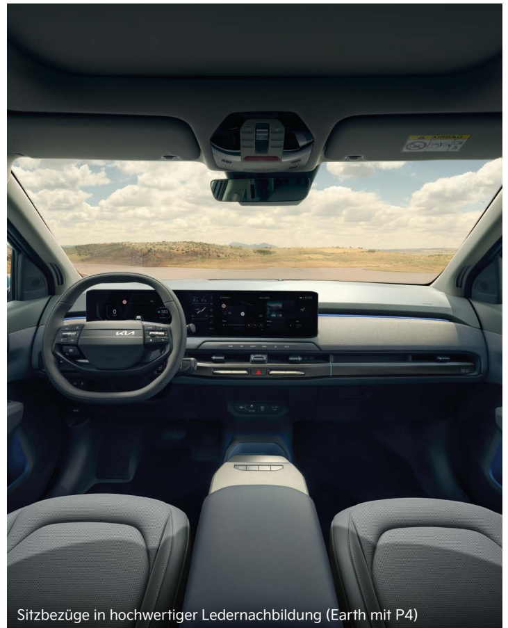
Sitzbezüge in hochwertiger Ledernachbildung (Earth mit P4)