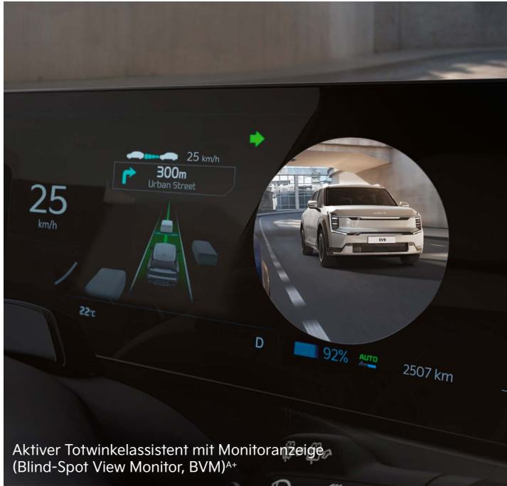
Aktiver Totwinkelassistent mit Monitoranzeige (Blind-Spot View Monitor, BVM) A+

Mit einem breiten Spektrum an aktiven Sicherheitssystemen A unterstützt dich der Kia EV3 dabei, in Gefahrensituationen schnell und angemessen zu reagieren.