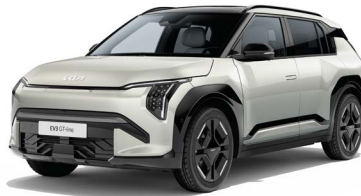
Ivory Silber Met. (ISG)