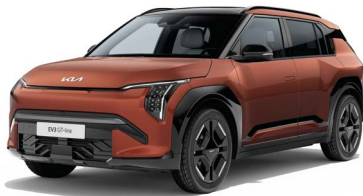
Terracotta Met. (TCT)