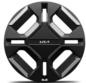
19-Zoll-Leichtmetallfelgen (Serie für GT-line)