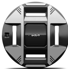
19-Zoll-Leichtmetallfelgen (optional für Earth)