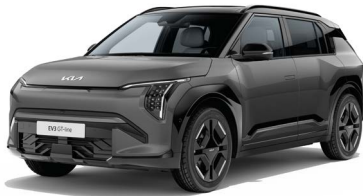
Schiefergrau Met. (EBD)