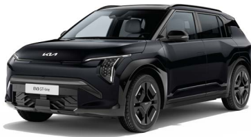
Auroraschwarz Met. (ABP)