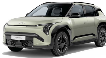
Aventurin Grün Met. (AG3)