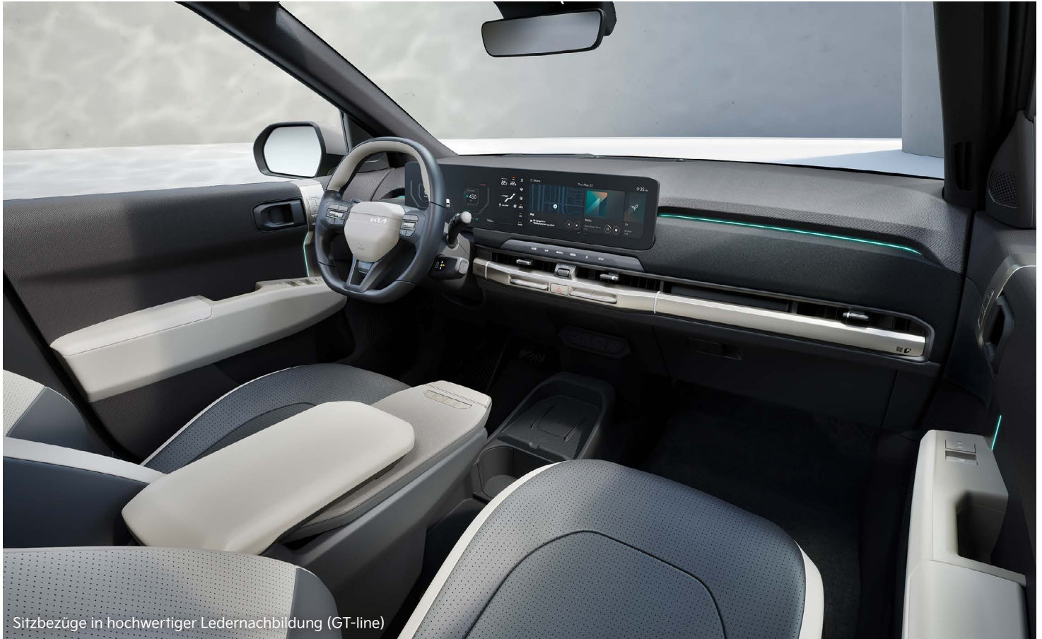
Sitzbezüge in hochwertiger Ledernachbildung (GT-line)

Progressives Design, viel Platz für bis zu fünf Reisende, clevere und zukunftsweisende Technologien – der vollelektrische Kia EV3 wird dich auf jeder Fahrt inspirieren.