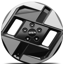
17-Zoll-Leichtmetallfelgen (Serie für Air & Earth)

Bei einigen unserer modernen Metallicfarben werden bewusst unterschiedliche Farbpigmente verwendet. Dadurch können unter bestimmten Lichtverhältnissen, z. B. direktes Sonnenlicht, attraktive Farbeffekte erzielt werden. Zum Teil kann die Farbe changieren, z. B. von Schwarz zu Dunkelblau. Bei den hier abgebildeten Farbdarstellungen kann es aufgrund der Drucktechnik zu Abweichungen zu den Originalfarben kommen. Weitere Informationen zu den Farbeffekten und Grundfarben erhältst du bei deinem Kia-Partner. Metalliclackierungen sind aufpreispflichtig.