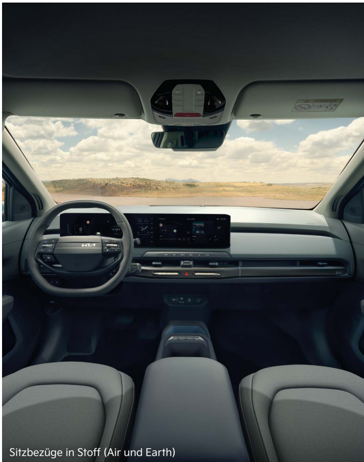
Sitzbezüge in Stoff (Air und Earth)