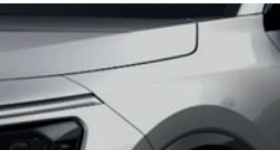
Steel Grey (KLG)**