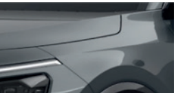
Interstellar Grey (AGT)**