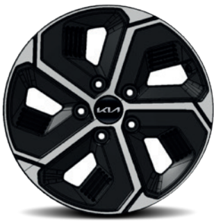
Jantes en alliage 16" avec pneus 205/60 R16 (de série sur Pure & Pulse, option sur Pace (PHEV))