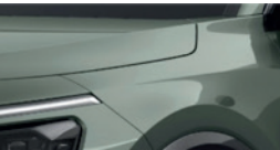
Cityscape Green (CGE)** (disponible en option sur Pace avec montant arrière noir)