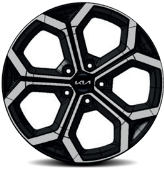
Jantes en alliage 18" avec pneus 225/45 R18 (de série sur Pace) (PHEV : perte d'autonomie en mode électrique d'env. 5 km)