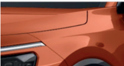
Orange Delight (DRG)** (disponible en option sur Pace avec montant arrière noir)