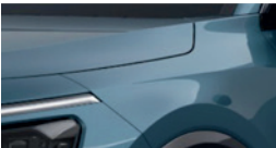
Mineral Blue (M4B)** (disponible en option sur Pace avec montant arrière noir)