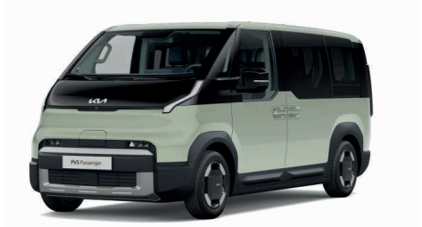
Soft Mint Metallic