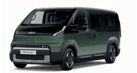
City Space Green Metallic