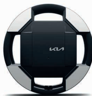
Air, Earth und Earth Plus (optional) Alufelgen - 16" (215/65 R16)