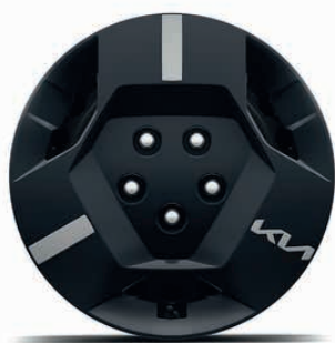
Air, Earth und Earth Plus Stahlfelgen mit Radzierkappe - 16" (215/65 R16)