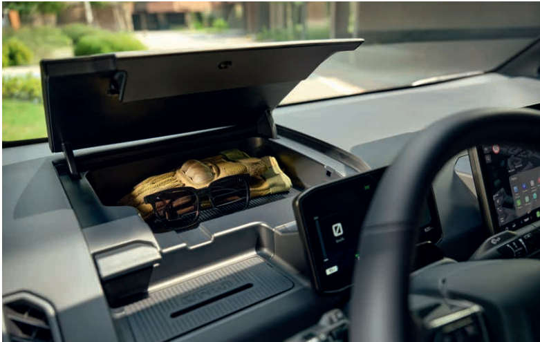
(Symbolfotos, tatsächliche Ausstattung kann abweichen)