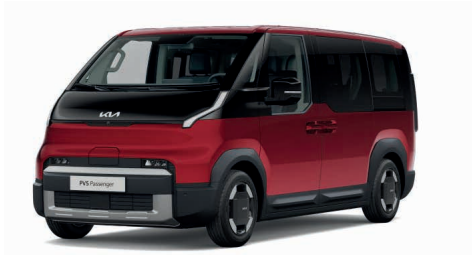
Runway Red Metallic