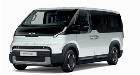
Snow White Pearl Pearl