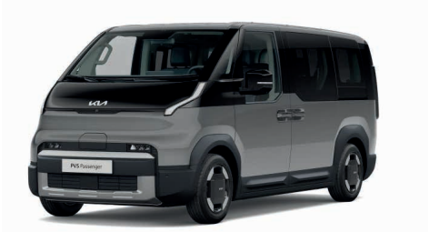
Steel Grey Metallic