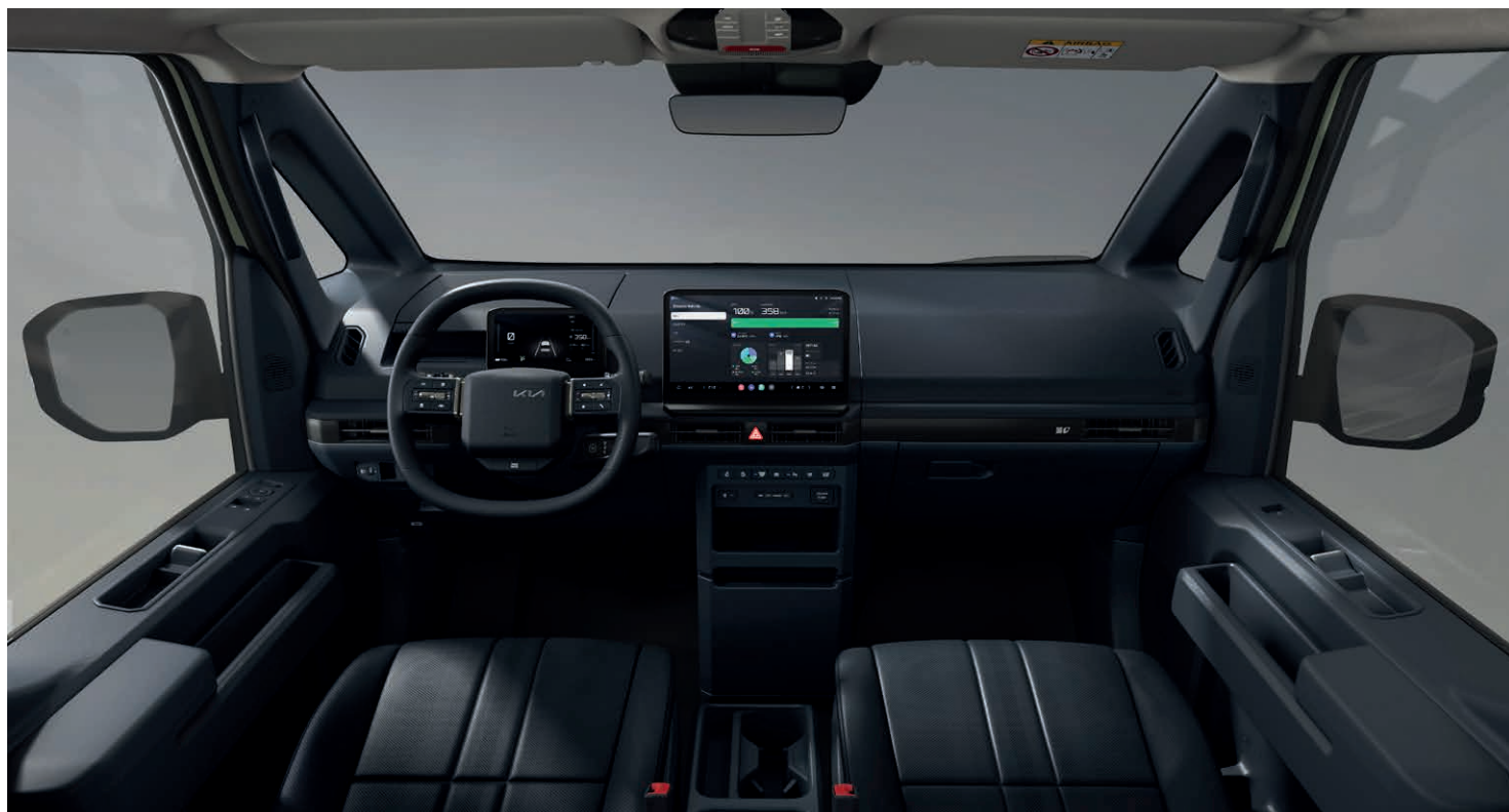
Air, Earth und Earth Plus Textil- und Kunstledersitze