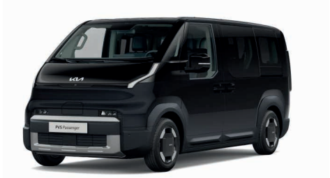
Aurora Black Pearl Pearl