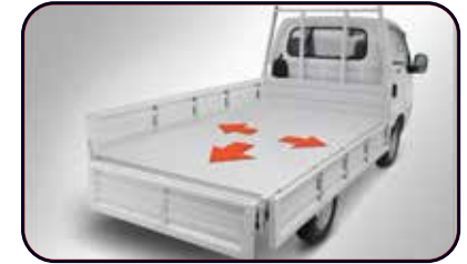
Bak dengan 3 Way Opening System