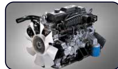
J2 Engine 2700cc