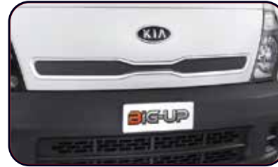
Desain Front Lid Lebih Modern