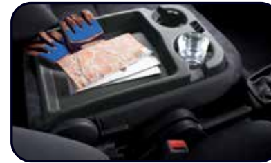
Konsol Sandaran Tangan