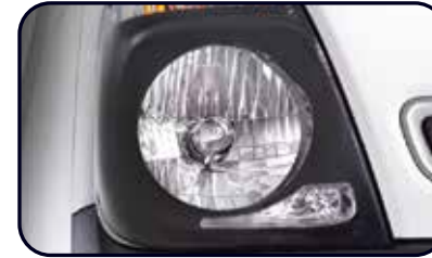
Head Lamp dengan Black Bezel