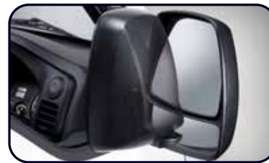
Outside Mirror Assist & Main Mirror Sighting