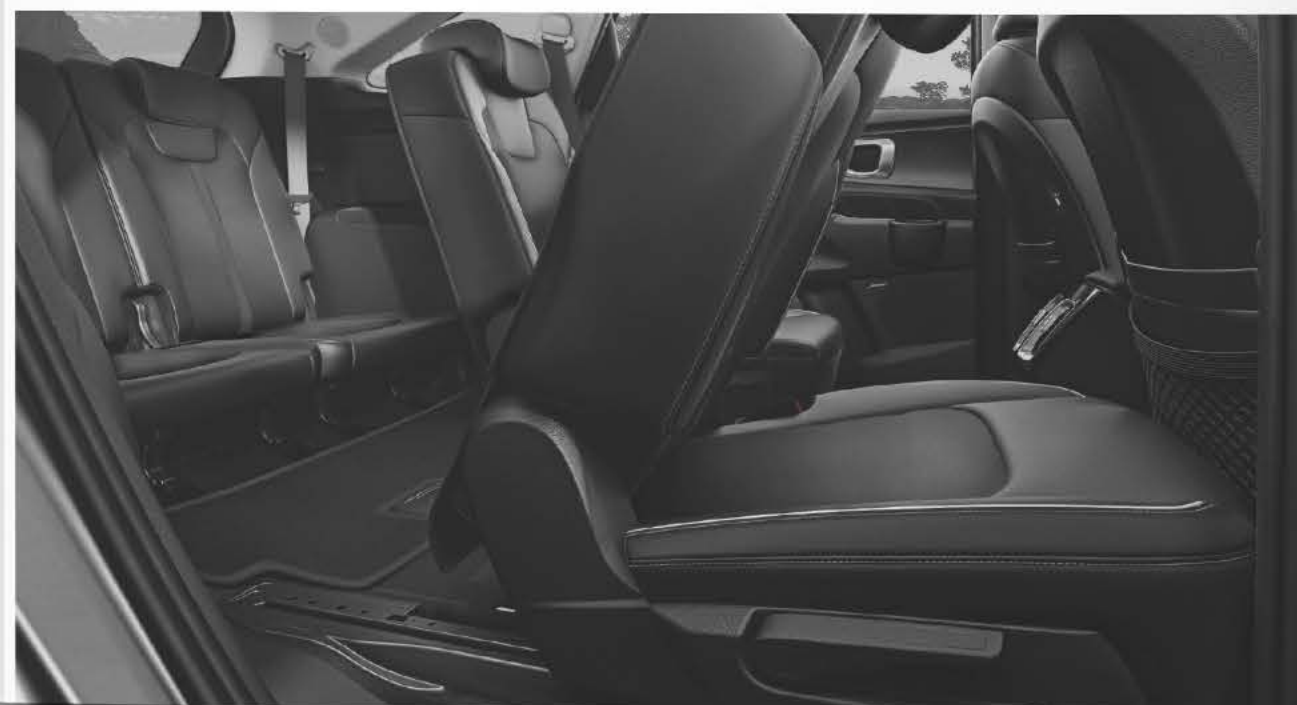
Asientos plegables con acceso Walk In.

All-New Sorento representa posibilidades y practicidad. Proporciona el espacio perfecto para la relajación, así como una increíble flexibilidad en caso de que necesites hacer espacio para una compra inusualmente grande y facilita los viajes de fin de semana.