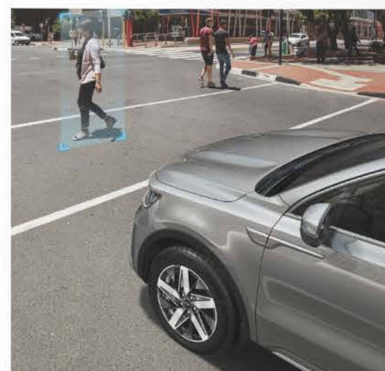
Sensores de proximidad delanteros y traseros.