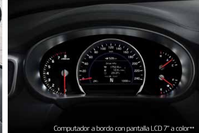
Computador a bordo con pantalla LCD 7" a color**