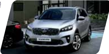
Sensor de proximidad delantero y trasero