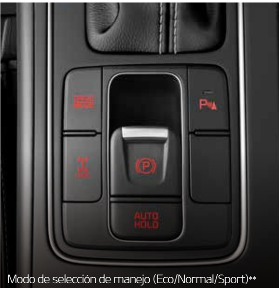
Modo de selección de manejo (Eco/Normal/Sport)**

Potencia (hp/rpm) 197 / 3.800 Torque (kg-f/rpm) 45 / 1.750-2.750