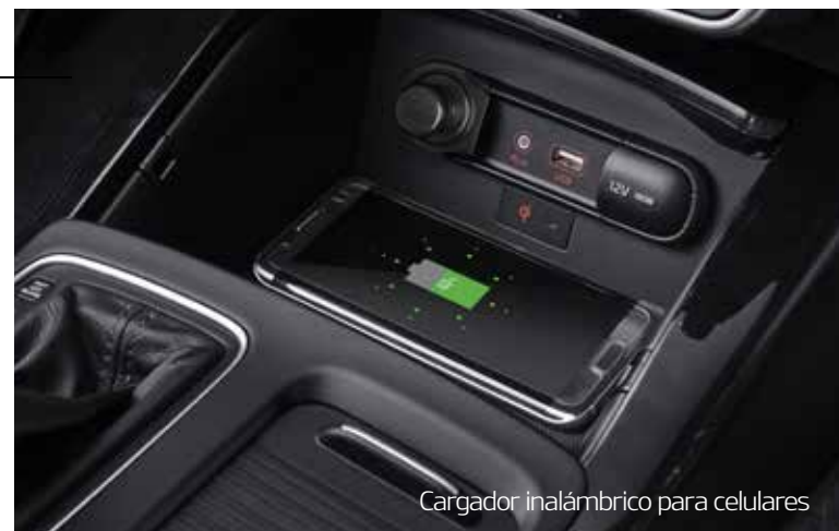
Cargador inalámbrico para celulares

El interior de Kia Sorento ofrece un alto estándar de comfort y de lujo que se caracteriza por los asientos firmemente diseñados y el sunroof panorámico** añade una nueva dimensión de calidez solar.