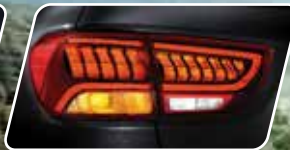
Luces traseras LED**