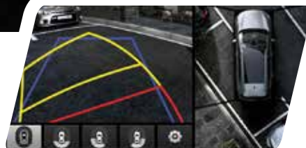
Cámara de estacionamiento 360° integrada en la radio