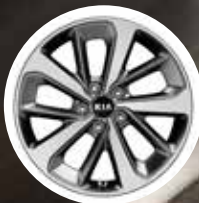
Llantas de aleación aro 18"*