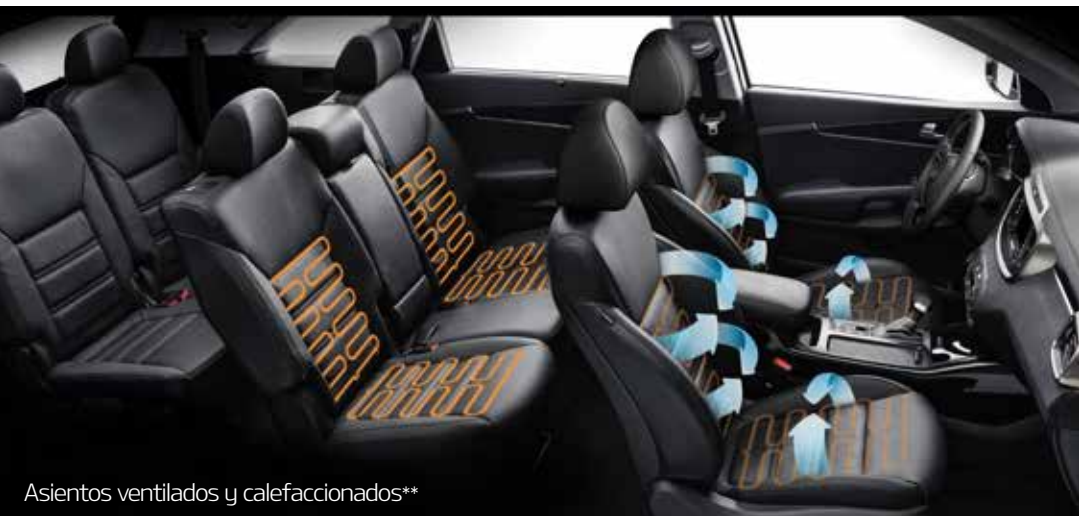
Asientos ventilados y calefaccionados**