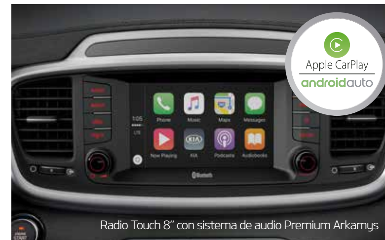
Radio Touch 8" con sistema de audio Premium Arkamys