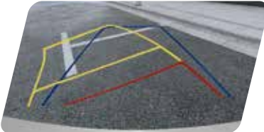
Cámara de retroceso con líneas adaptativas dinámicas