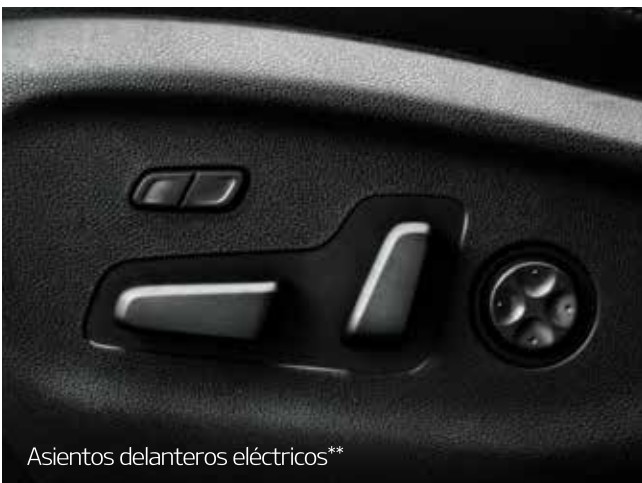
Asientos delanteros eléctricos**