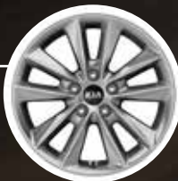
Llantas de aleación aro 17"