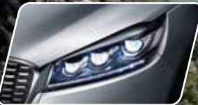
Faros y luces de circulación diurnas LED**

En un momento en que el placer de conducción coincide con la necesidad de espacio, conectividad y el gusto por la sofisticación, Kia Sorento llega para salvarte el día.