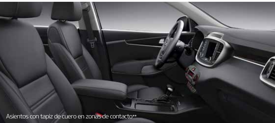
Asientos con tapiz de cuero en zonas de contacto**