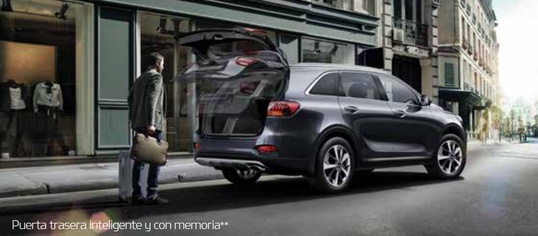
Puerta trasera inteligente y con memoria**