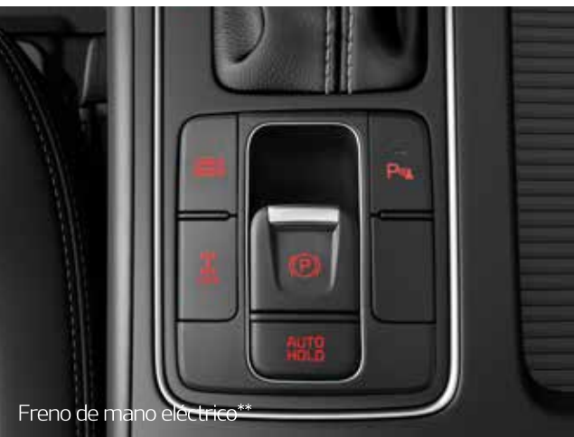
Freno de mano eléctrico**

No hay límites para disfrutar del espacio que ofrece Kia Sorento. Todo comienza con los asientos ergonómicos, cómodos y altamente versátiles.