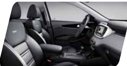
Asiento pasajero con ajuste lumbar eléctrico y "Walk in Access"