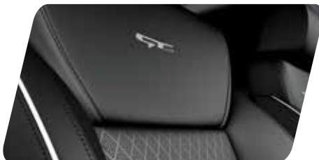
Asientos delanteros con emblema GT-Line