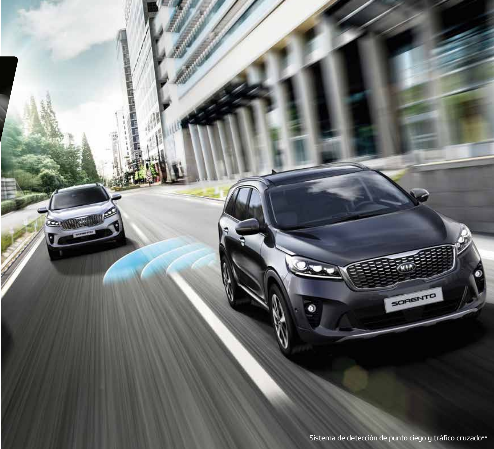
Sistema de detección de punto ciego y tráfico cruzado**