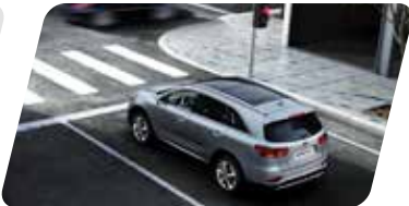
Asistente de partida en pendiente (HAC)**