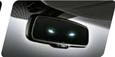
Espejo retrovisor electrocromático