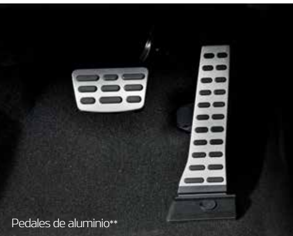
Pedales de aluminio**