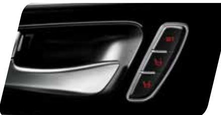
Asiento del conductor con memoria