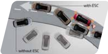
Control de estabilidad (ESC)**