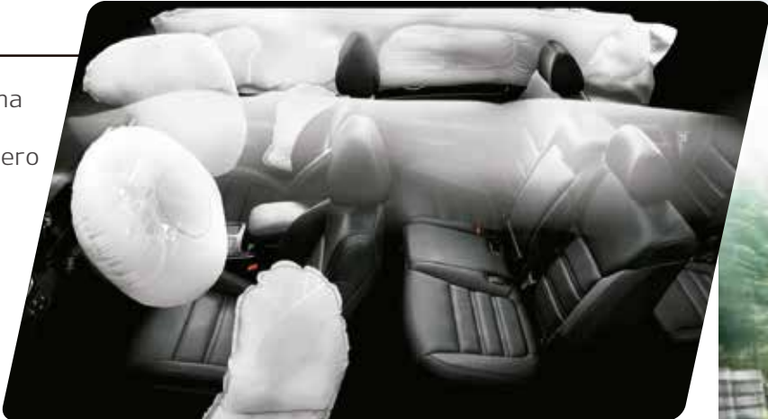
Airbags laterales y de cortina**