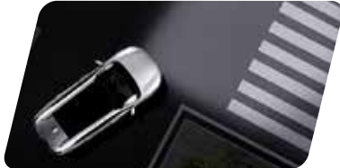
Luces delanteras adaptativas**