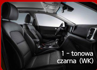
1 - tonowa czarna (WK)