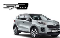
KCS Sparkling Silver