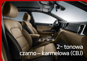
2 - tonowa czarno - karmelowa (CBJ)