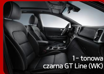
1 - tonowa czarna GT Line (WK)