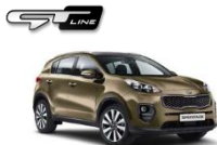
A2E Alchemy Green (bez dopłaty)