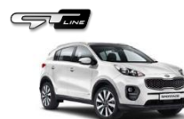
HW2 Deluxe White