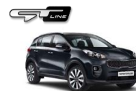
1K Black Pearl