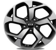
Cerchi in lega 17" 225/60R17