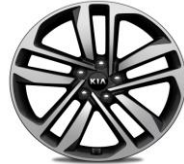
Cerchi in lega 19" 245/45R19