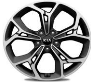
Cerchi in lega 19" GT Line 245/45R19