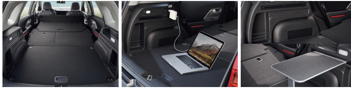
평탄화 보드 실내 V2L 콘센트 라기지 멀티 수납트림(좌/우) / 캠핑 테이블