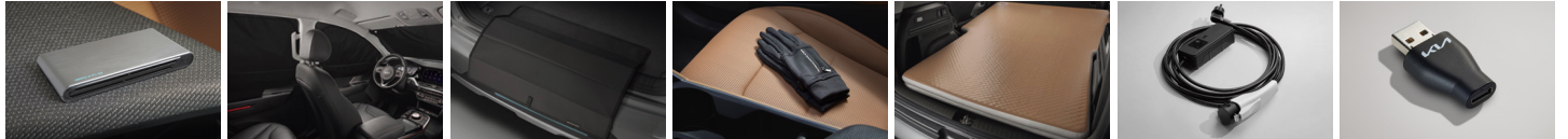
카드 홀더 멀티커파 (전면/1열/2열) 로드 프로텍터 EV 충전 장갑 에어 매트 비상용 완속 충전 케이블(220V ICCB) A to USB-C 변환 젠더* (CCB)