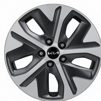
17인치 전면가공 휠