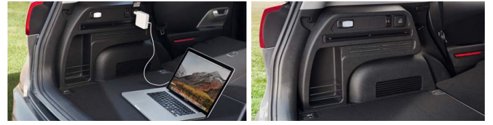
실내 V2L 콘센트 라기지 멀티 수납트림(좌)