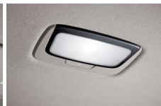
LED 롬 램프