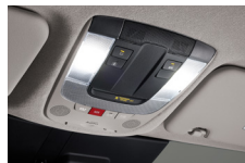
LED 오버헤드콘솔 램프