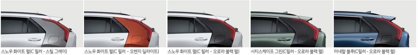
스노우 화이트 펠(C 필라 - 스틸 그레이)