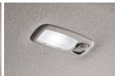
LED 선바이저 램프