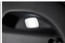
LED 러기지 램프