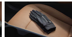
EV 충전 장갑