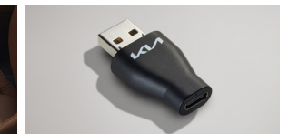
A to USB-C 변환 젠더*