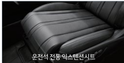
운전석 전동 익스텐션시트