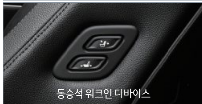
동승석 워크인 디바이스