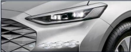
프로젝션 LED 헤드램프 / LED 주간주행등 / LED 턴시그널