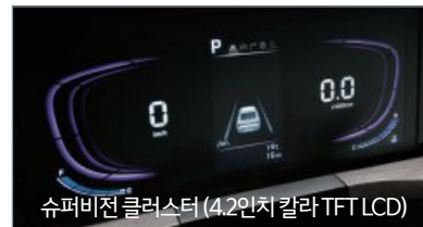
슈퍼비전 클러스터 (4.2인치 칼라 TFT LCD)