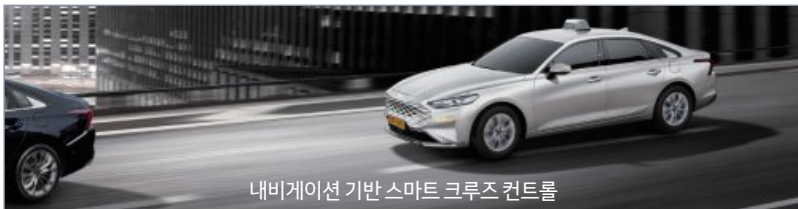
내비게이션 기반 스마트 크루즈 컨트롤