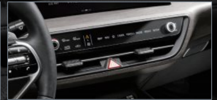
인포테인먼트 / 공조 전환 조작계