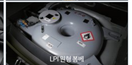
LPI 원형 bombe

※ 상기 사양 구성은 차급 및 선택 사양에 따라 다르게 적용됩니다. ※ 본 인쇄물에 수록된 제품 색상 및 이미지는 실제와 다를 수 있습니다.