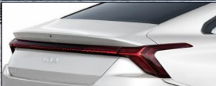
LED 리어 콤비네이션램프