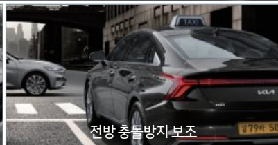
전방 충돌방지 보조