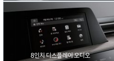
8인치 디스플레이 오디오