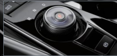
전자식 변속 다이얼 / 전자식 파킹브레이크