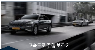
고속도로 주행 보조 2