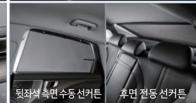
뒷좌석 측면수동 섀터