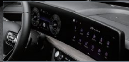
파노라믹 커브드 디스플레이