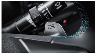
패들 슈프트(화생제동 컨트롤)