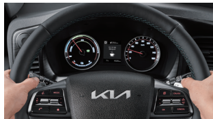
운전자 주의 경고