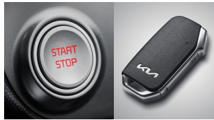
버튼시동 스마트키 시스템