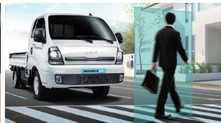
전방 충돌방지 보조(차량/보행자)