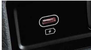
C타입 USB 단자(충전용)