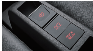
전자식 파킹 브레이크(오토홀드 포함)