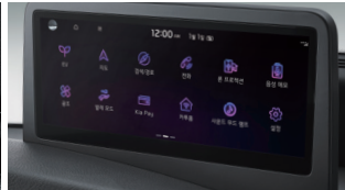
10.25인치 내비게이션/후방 모니터