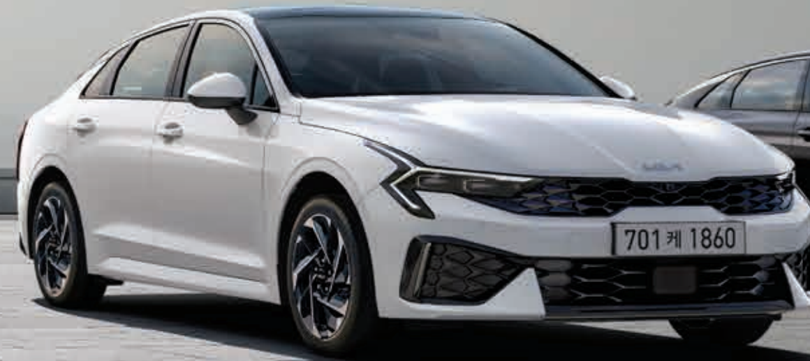
2.0 하이브리드 _ 스노우 화이트 펄 (SWP)