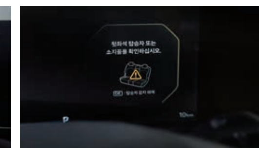
후석 승객 알림