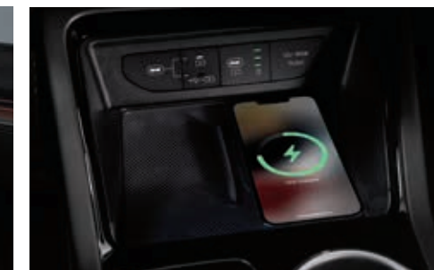
스마트폰 무선충전 시스템