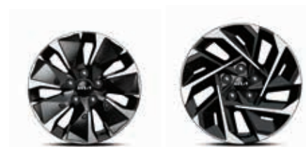
16인치 전면가공 휠 (하이브리드 전용 휠) 17인치 전면가공 휠 (하이브리드 전용 휠)