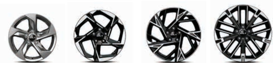
16인치 알로이 휠 17인치 전면가공 휠 18인치 전면가공 휠 19인치 전면가공 휠 (1.6 가솔린 터보 전용)