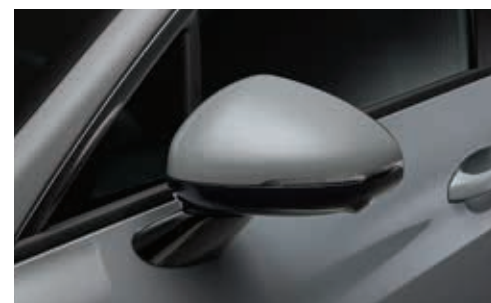
LED 리피터 일체형 아웃사이드미러