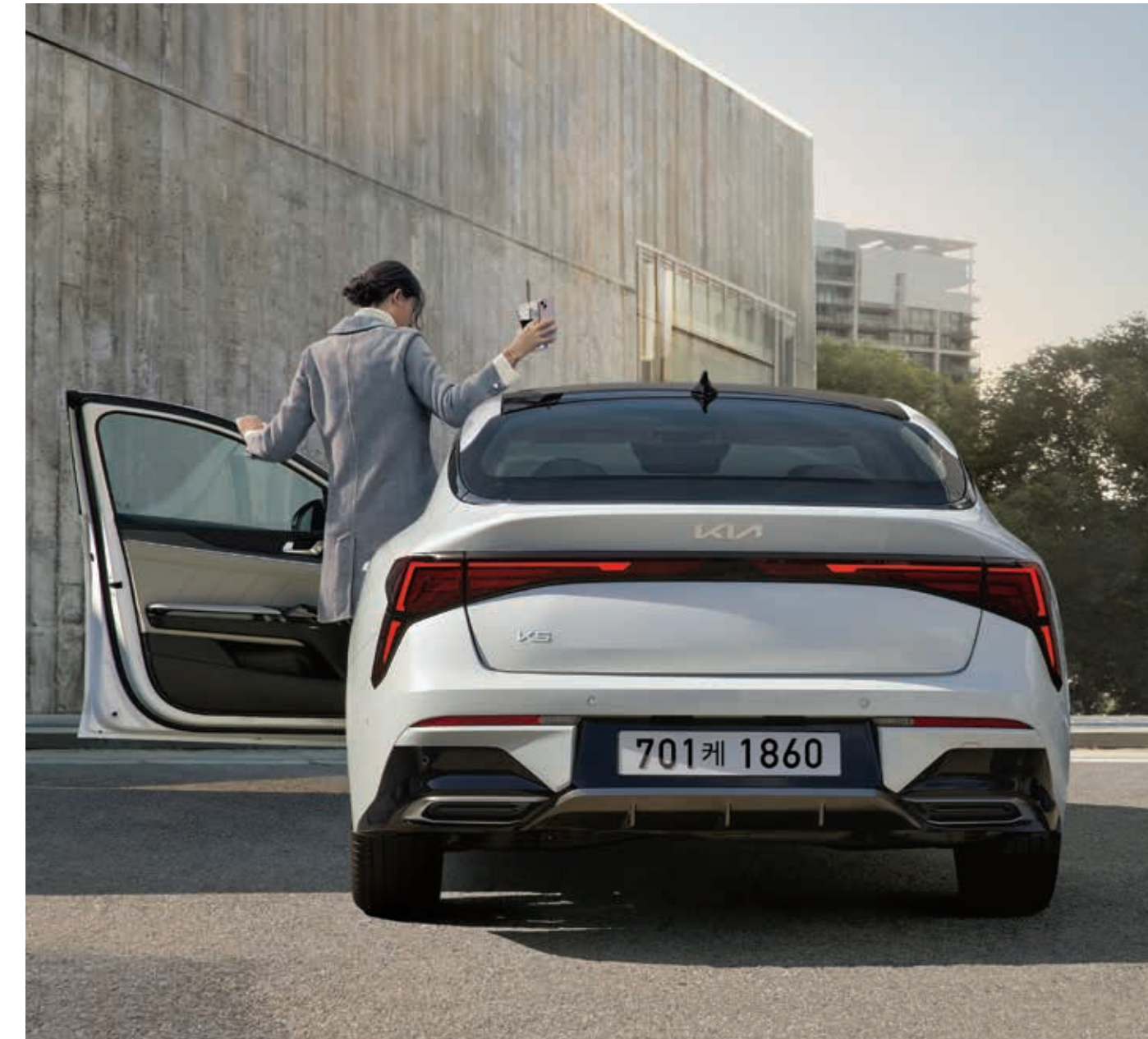
2.0 가솔린_ 스노우 화이트 펄 (SWP) / 상기 사양구성은 트림 및 선택 사양에 따라 다르게 적용됩니다.