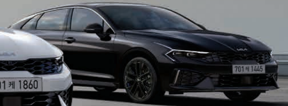
1.6 가솔린 터보 _ 오로라 블랙 펄 (ABP) / 블랙 핏