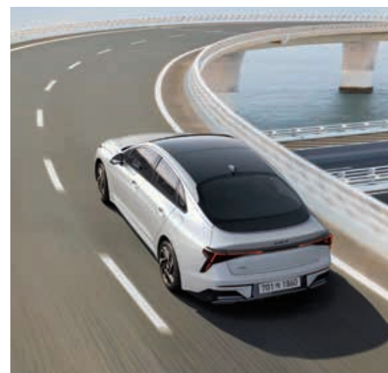
e-핸들링 모터의 가감속으로 전후륜의 하중을 조절해 조향 시작 시 주행 민첩성을, 조향 복원 시 주행 안정성을 향상해 줍니다.