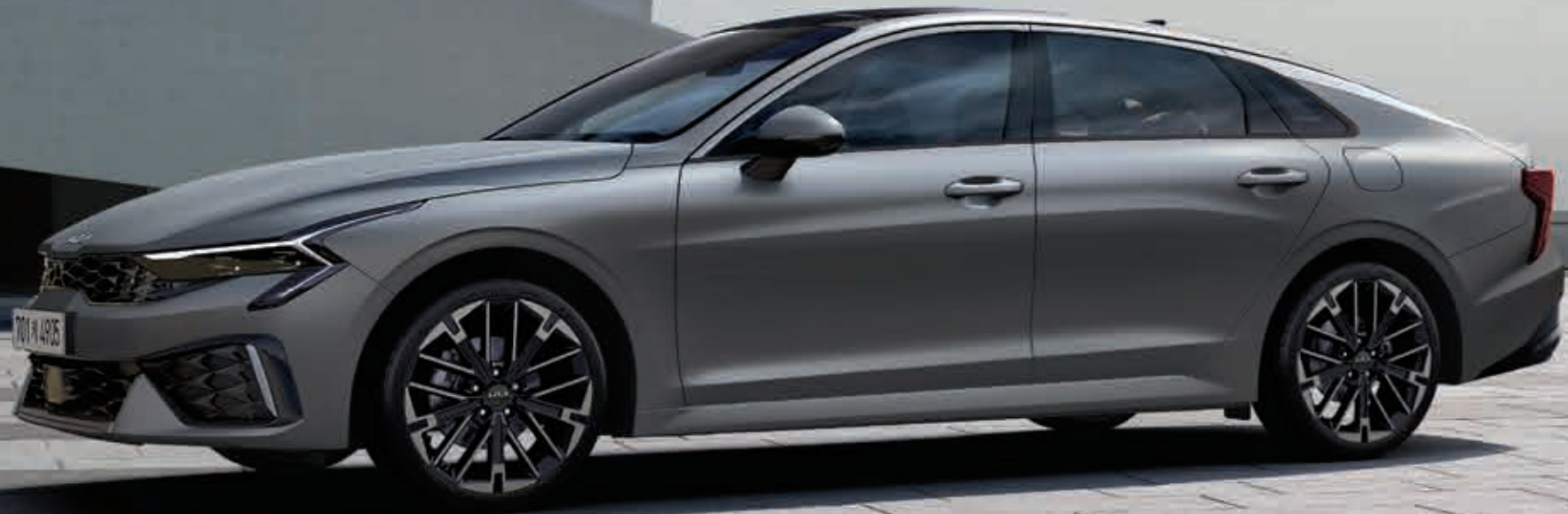
1.6 가솔린 터보 _ 문스케이프 매트 그레이 (KLM)