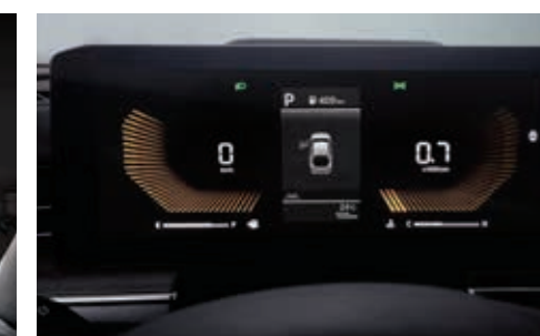
슈퍼비전 클러스터(4.2인치 칼라 TFT LCD)