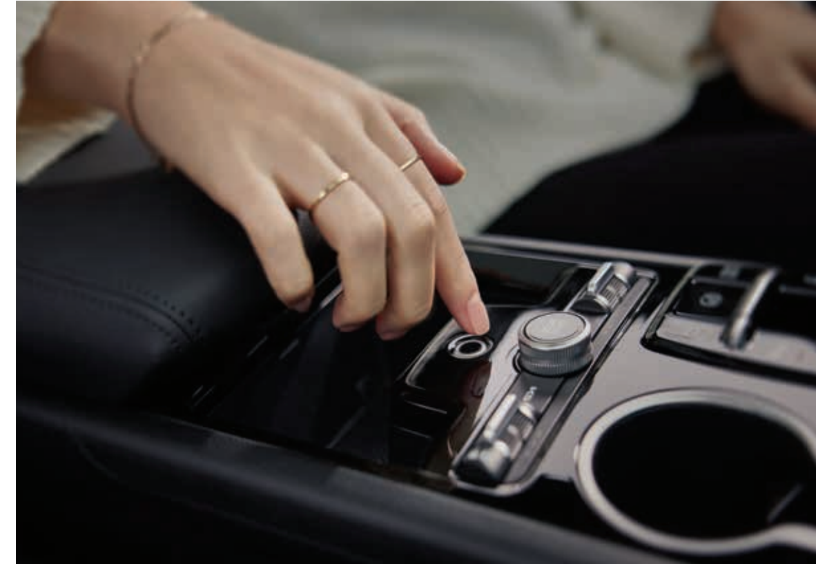
지문 인증 시스템

※ 인포테인먼트 시스템 화면 이미지는 업데이트에 따라 변동될 수 있습니다.