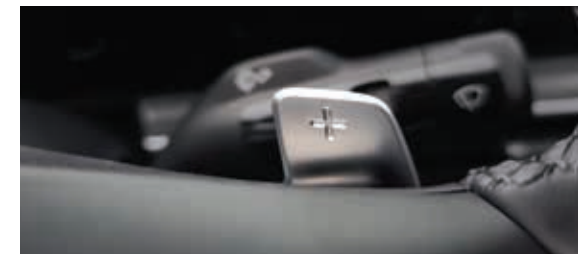
하이브리드 전용 콘텐츠 차량의 주행 정보 및 연비 정보, 에너지 흐름도 등 다양한 하이브리드 전용 콘텐츠로 드라이빙에 필요한 정보를 제공합니다. 패들 슈프트(회생제동 컨트롤 포함) 회생 제동량을 단계별로 조절이 가능하여 운전 스타일에 맞는 드라이빙 경험을 제공합니다.

2.0 하이브리드 152 가솔린 엔진 최고출력 ps / 6,000rpm 38.6 전기 모터 최고출력 kW 19.2 가솔린 엔진 최대토크 kgf·m / 5,000rpm 205 전기 모터 최대토크 Nm