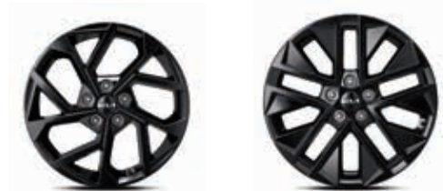
18인치 블랙 알로이 휠 (블랙 핏 전용) 19인치 블랙 알로이 휠 (1.6 가솔린 터보, 블랙 핏 전용)