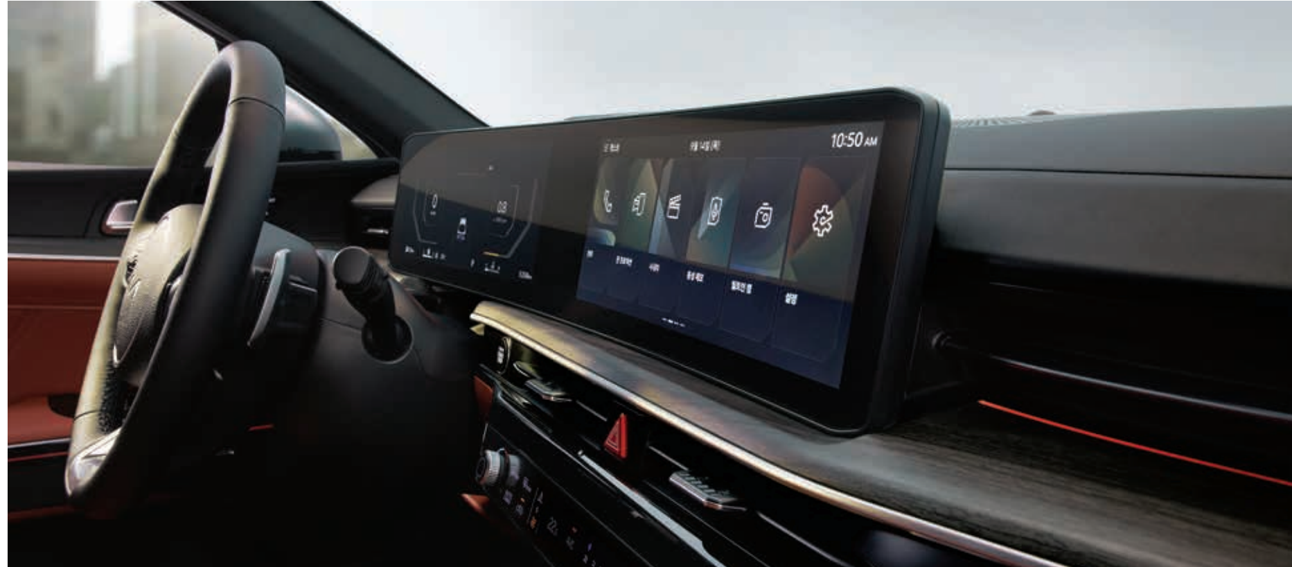
파노라믹 와이드 디스플레이

손끝 하나로 제어되는 스마트한 편의 사양으로 드라이빙의 편리함과 즐거움을 선사합니다.