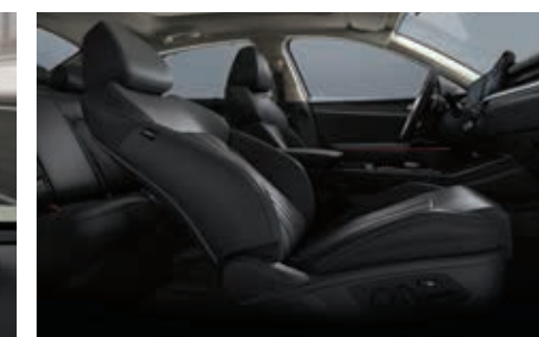
동승석 릴렉션 컴포트 시트