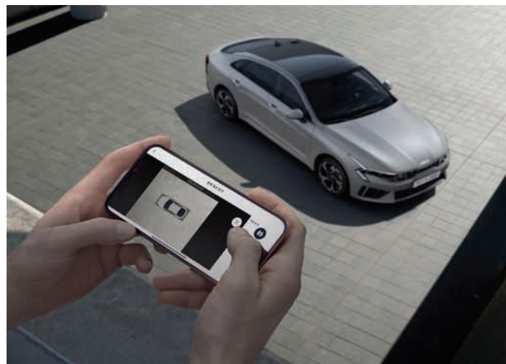
리모트 360° 뷰 (차량 주변 영상)