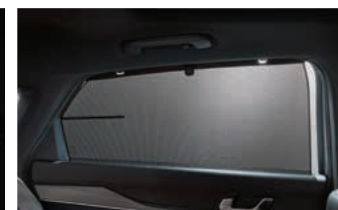
뒷좌석 측면 수동 선커튼