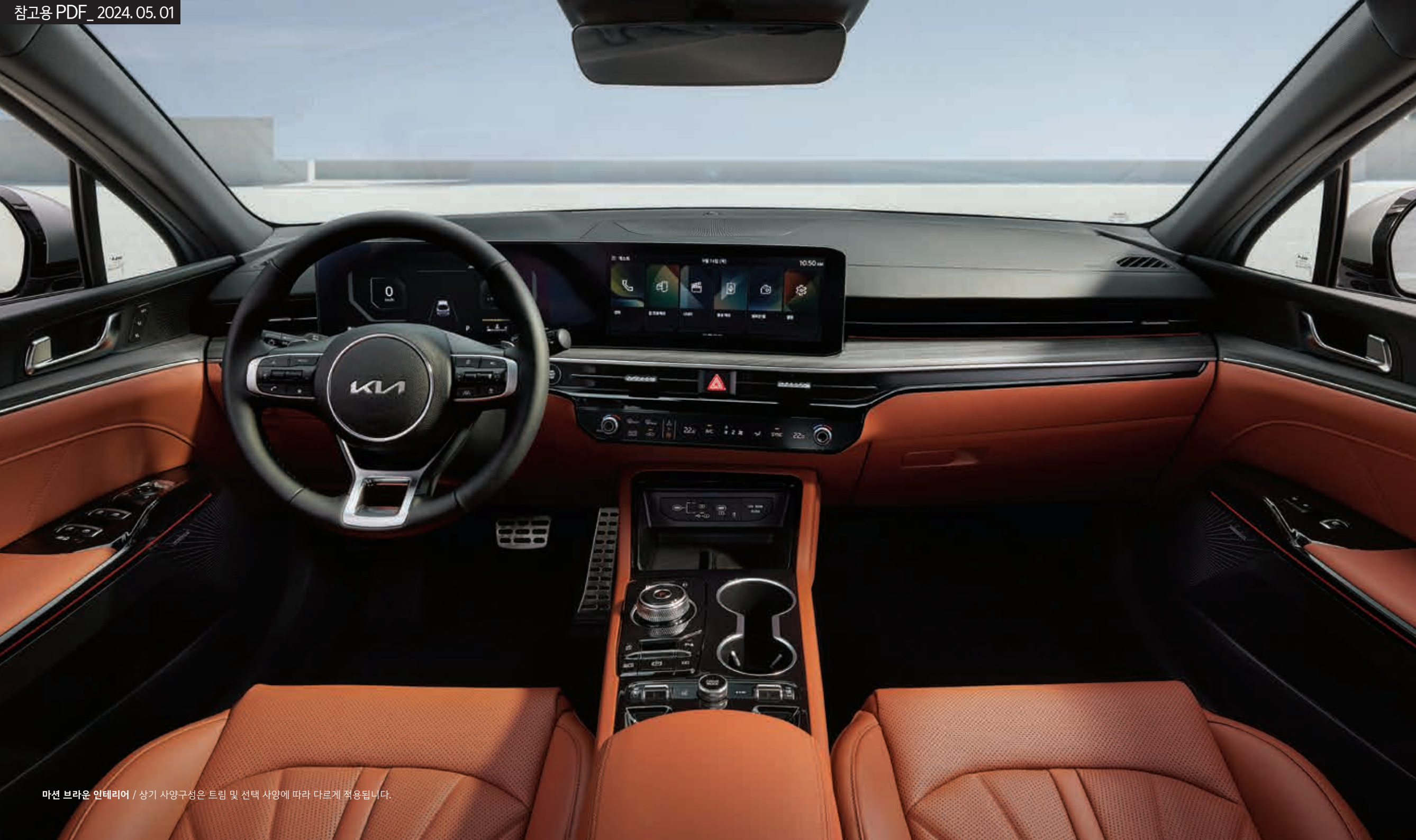
마션 브라운 인테리어 / 상기 사양구성은 트림 및 선택 사양에 따라 다르게 적용됩니다.