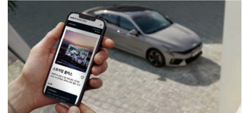
기아 커넥트 스토어

인포테인먼트 시스템을 통해 사전에 지문을 등록하면 키를 미소지한 상태에서도 Kia Connect 서비스로 도어를 열고 지문 인증으로 시동을 걸 수 있습니다. 또한 지문 인증으로 간편하게 개인화 프로필을 설정하고, 보다 안전하게 발레 모드 해제와 Kia CarPay 기능을 사용할 수 있습니다.