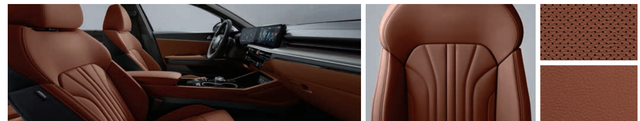
마션 브라운 인테리어