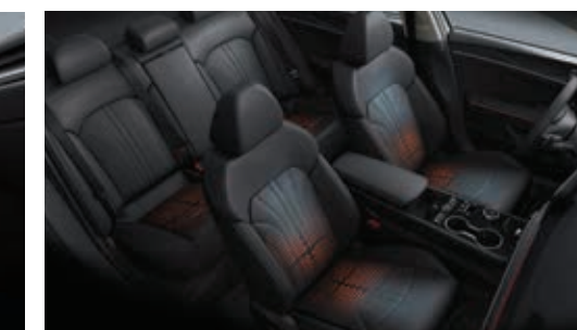
앞좌석 통풍시트 / 전좌석 열선시트*