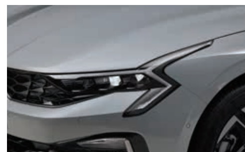
LED 헤드램프, LED 주간주행등