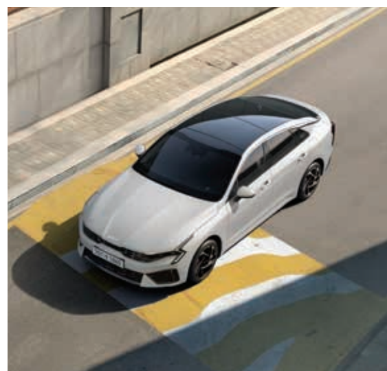
e-라이드 과속 방지턱과 같은 둔턱 통과 시 차량이 운동 방향과 반대 방향의 관성력을 발생하도록 모터를 제어해 편안한 승차감을 제공합니다.

도로나 주행여건에 따라 스스로 구동을 제어하는 기술로 주행 효율뿐만 아니라, 안정성까지 한층 업그레이드하였습니다.