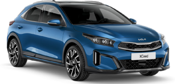
Gökyüzü Mavi (B3L)