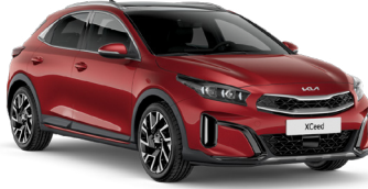
Manyetik Kırmızı (AA9)