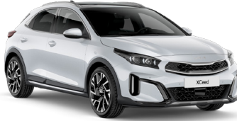
İnci Beyaz (HW2)