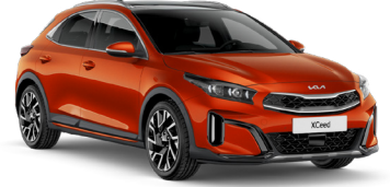
Füzyon Turuncu (RNG)