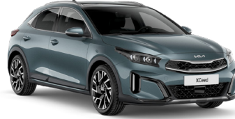
Yuka Gri (USG)