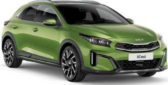
Seladon Yeşil (CE6)