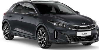
Fırtına Gri (H8G)