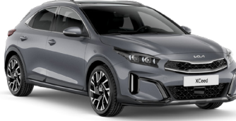
Aytaşı Gri (CSS)