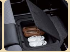
2열 플로어 언더 트레이