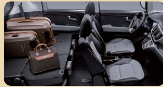
2열 시트 폴딩