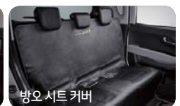
방오 시트 커버