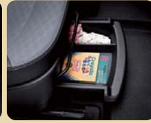
동승석 시트 언더 트레이