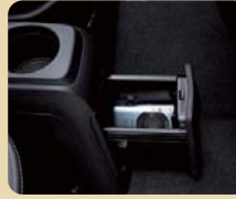
고급형 센터 콘솔 서랍장