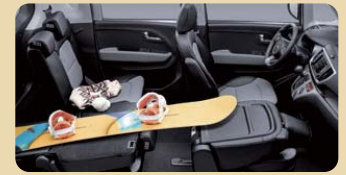
1-2열 시트 분할 폴딩