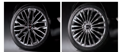
18인치 전면가공 휠