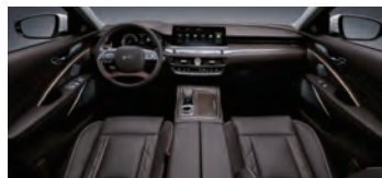
다크 브라운 원톤