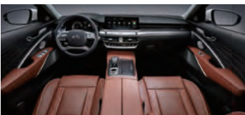
시에나 브라운 스페셜 (퀵팅 나파 가죽 시트 限)