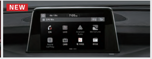
NEW 스마트 내비게이션 UVO 3.0 (무로기간5년) - 8인치 심리스 타입