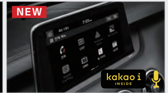
NEW 카카오이(서버형 음성인식)