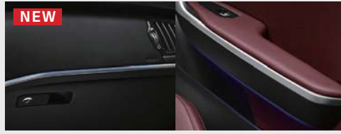
NEW 인테리어 무드 조명(6개 컬러)