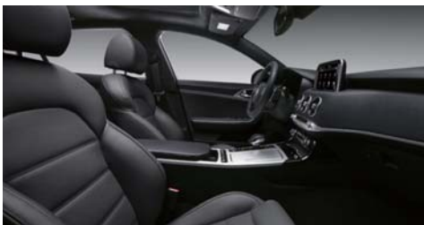
블랙 원톤 인테리어