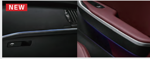
NEW 인테리어 무드 조명(6개 컬러)