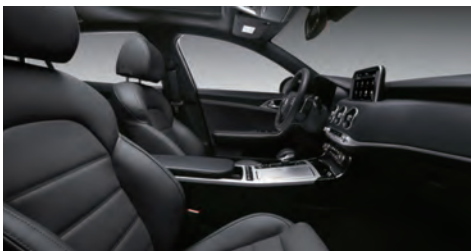
블랙 원톤 인테리어