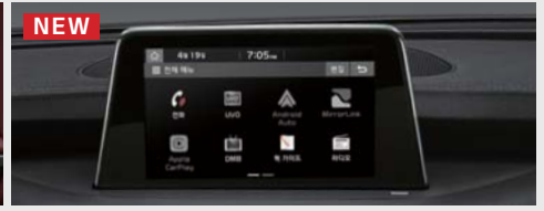
NEW 스마트 내비게이션 UVO 3.0 (무로기간5년) - 8인치 심리스 타입