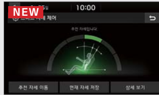
NEW 운전석 스마트 자세 제어 시스템