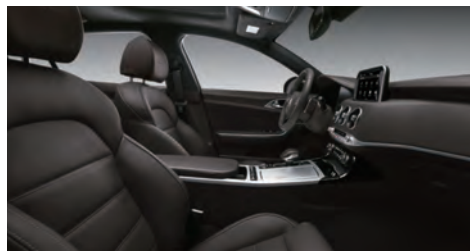
브라운 원톤 인테리어