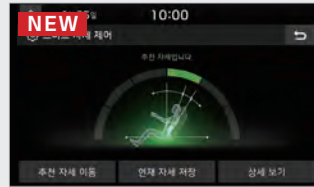
NEW 운전석 스마트 자세 제어 시스템