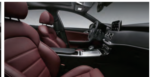
다크 레드 팩 (GT 전용)