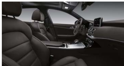
브라운 원톤 인테리어