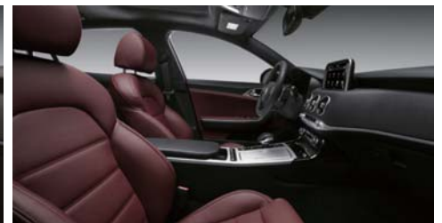
다크 레드 팩 (GT 전용)