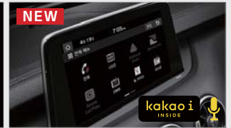
NEW 카카오 i (서버형 음성인식)