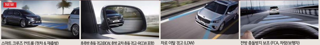
스마트 크루즈 컨트롤 (정차 & 재출발)

Hassle Free, Delightful Driving 안전을 넘어 보다 즐겁고 기분 좋은 운전