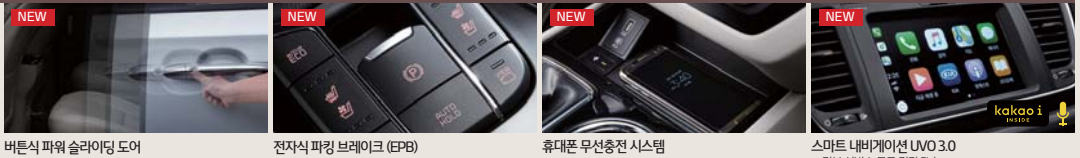
버튼식 파워 슬라이딩 도어

Smart & Comfort Driving 스마트한 운전의 재미를 주는 첨단 기능