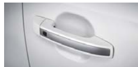
반광크롬 아웃사이드 핸들