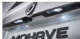
LED 번호판 램프