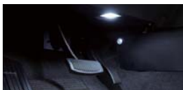
LED 풋 무드 조명 & 풋 램프