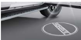
LED 도어 스팟 램프