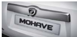
반광크롬 테일게이트 가니쉬