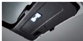
LED 테일게이트 램프