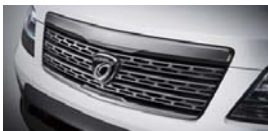
반광크롬 라디에이터 그릴