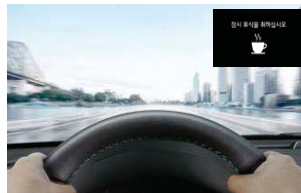
운전자 주의 경고 (DAW)