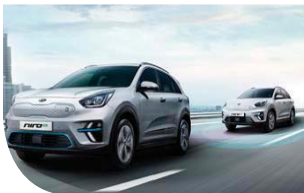
차로 유지 보조 (LFA)