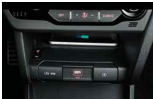
휴대폰 무선충전 시스템