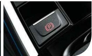
전자식 파킹 브레이크 (EPB, 오토홀드 포함)