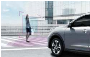
전방 충돌방지 보조 (FCA, 차량/보행자 감지)