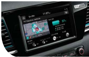
스마트 내비게이션 UVO 3.0(8인치)

세심한 배려가 돋보이는 첨단 편의사양으로 수준이 다른 편리함을 드립니다.