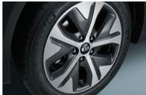
17인치 알로이 휠