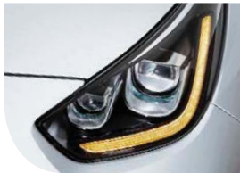
LED 헤드램프 & LED 턴시그널