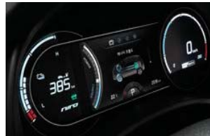
슈퍼클러스터 (7인치 컬러 TFT LCD)