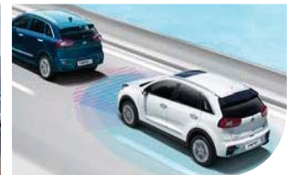
스마트 크루즈 컨트롤(SCC, 정차/재출발 기능포함)