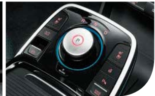
다이얼식 SBW(Shift by Wire)