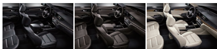
블랙 원톤 인테리어