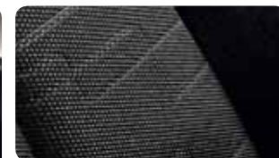
Stoffen zetelbekleding met zilveren rand type 'Embossed'