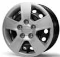
LOUNGE - MIND - WORLD EDITION Stalen velgen met 195/65 R15 banden en wieldeksels