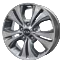
SENSE Aluminium velgen met 205/55 R16 banden