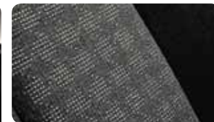
Stoffen zetelbekleding type 'Houndtooth check'