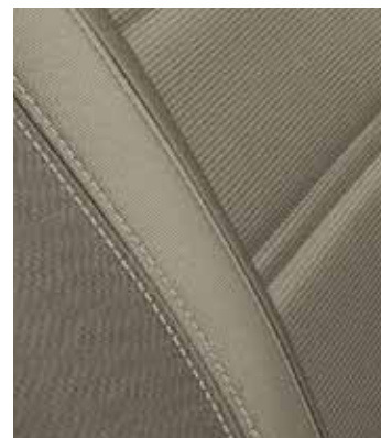
Beige zetelbekleding met beige interieurbekleding (gratis optie)