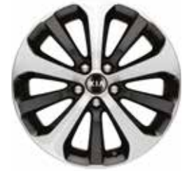
FUSION 18" aluminium velgen met 235/60 banden