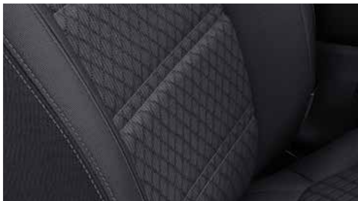
Zwarte stoffen zetelbekleding met zwarte interieurbekleding