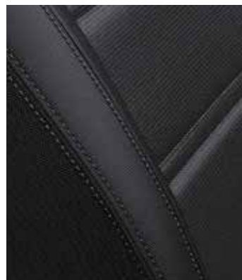
Zwarte stoffen zetelbekleding met zwarte interieurbekleding