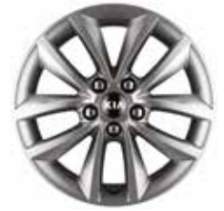
LOUNGE en optie FUSION 17" aluminium velgen met 235/65 banden