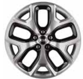
SENSE 19" aluminium velgen met 235/55 banden