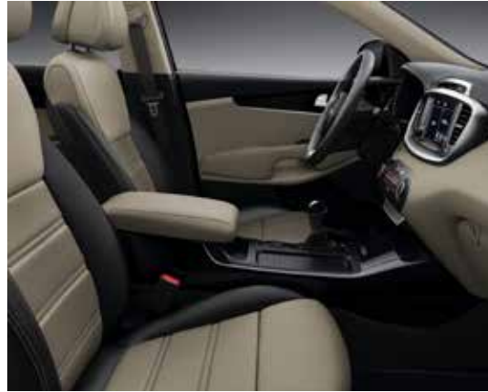
Beige lederen zetelbekleding met beige interieurbekleding (gratis optie)