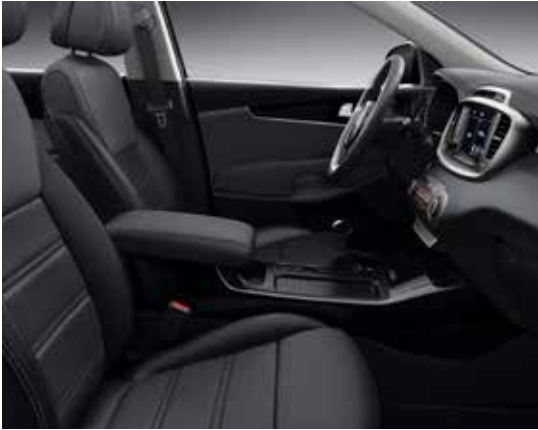
Zwarte lederen zetelbekleding met zwarte interieurbekleding