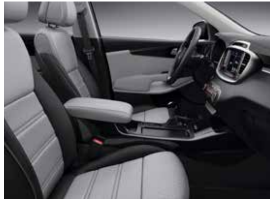
Zwart-grijze lederen zetelbekleding met zwarte interieuraankleding (optie)