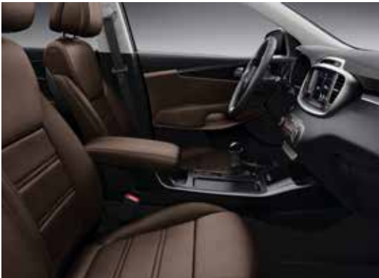
Bruine lederen zetelbekleding met zwarte interieuraankleding (optie)